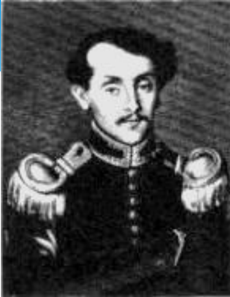
Николай Ильич, отец Л.Н.Толстого