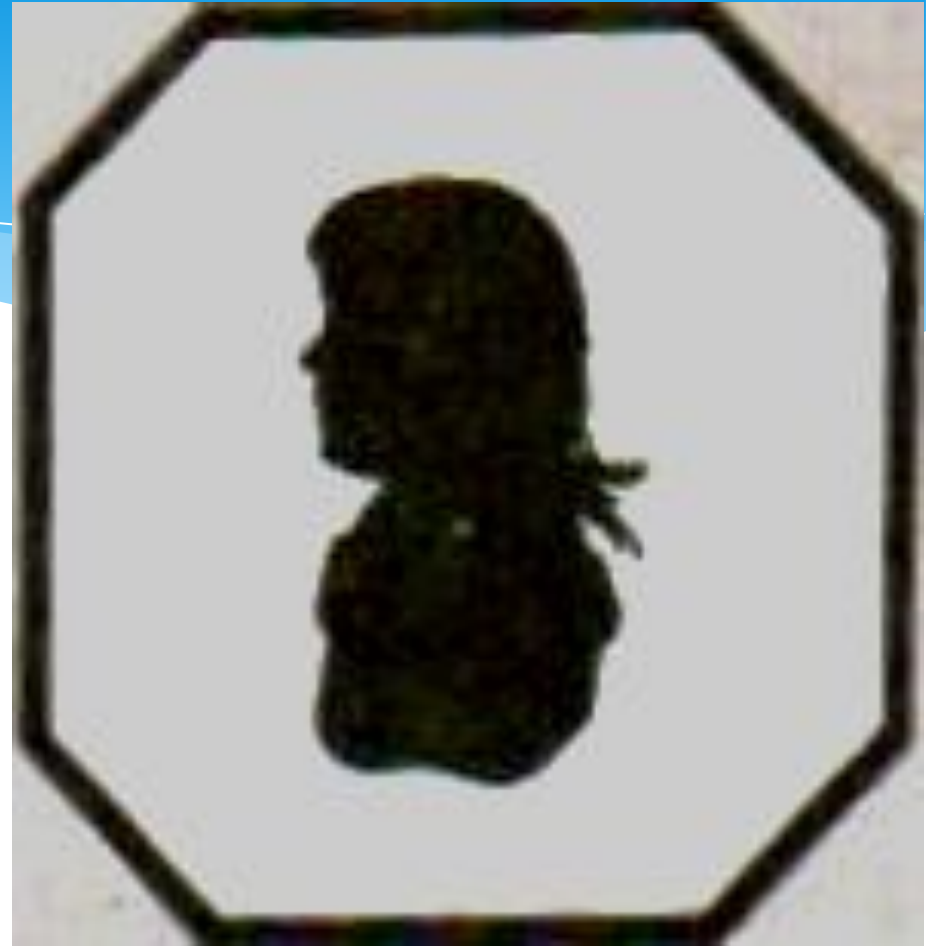
Мария Николаевна Волконская в детстве, мать Л.Н.Толстого.