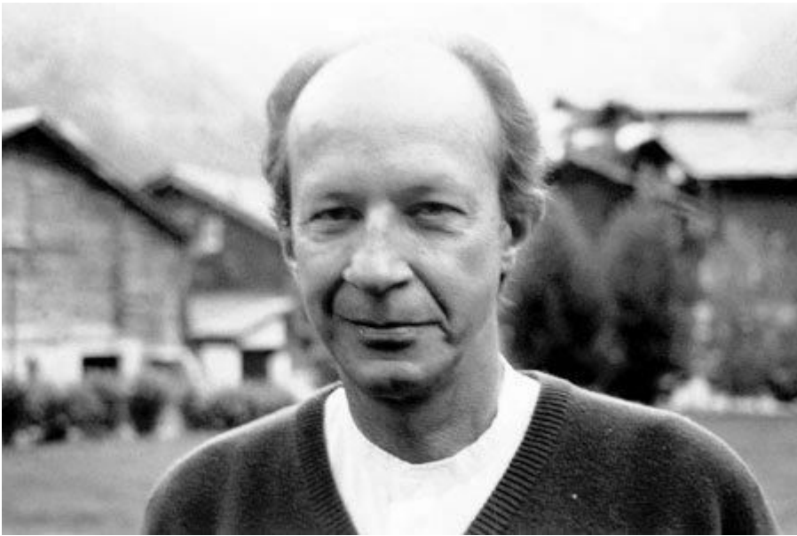
Джорджо Агамбен (1942 - )

Агамбен писал, что важнейшей для создания общества операцией, операцией поддерживающей общество выступает т.н. «антропологическая машина» порождающая различие человека и животного. Только человеческое в полной мере способно к социальности, животное нет. Но животное как исключается, так и преобразовывается человеческим. Антропологическая машина все время работает, производя сходства и различия — сама эта работа и есть критерий «социальности». Исключение-включение природного — фактор становления социального.