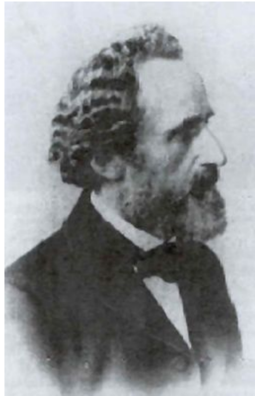
Эрнст Капп (1808-1896)

от τέχνη — искусство, мастерство, умение