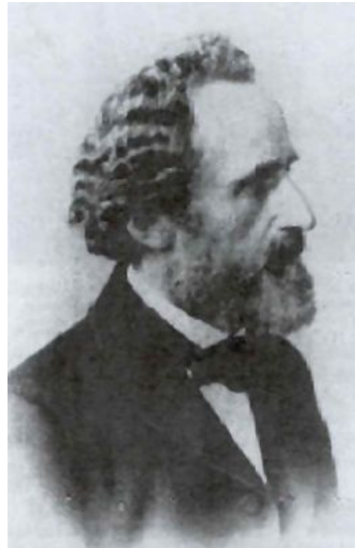
Эрнст Капп (1808-1896)

«...человек, в целях конструкции машин, должен был бессознательно возвращаться к самому себе, чтобы, по образцу цельных, живых членов своего организма, привести части мёртвой машины в согласованное, целесообразное движение»