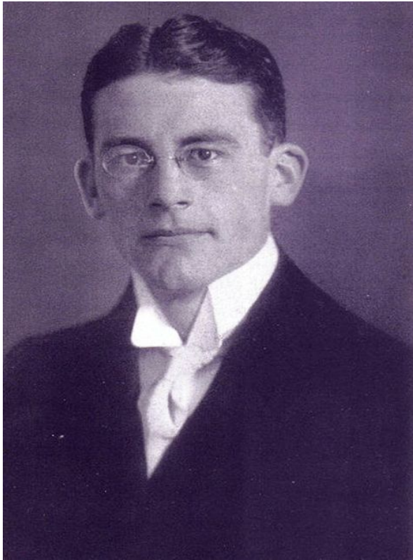
Карл Шмитт (1888-1985)

Что такое «политическое»? (из работы «Понятие политического»)