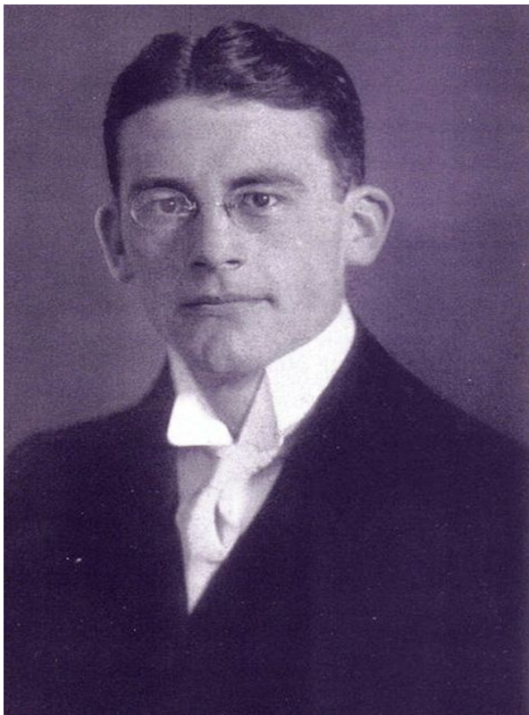
Карл Шмитт (1888-1985)

Что такое «политическое»? (из работы «Понятие политического»)