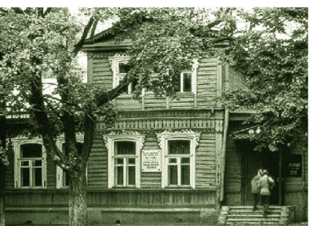
Дом, где родился писатель.