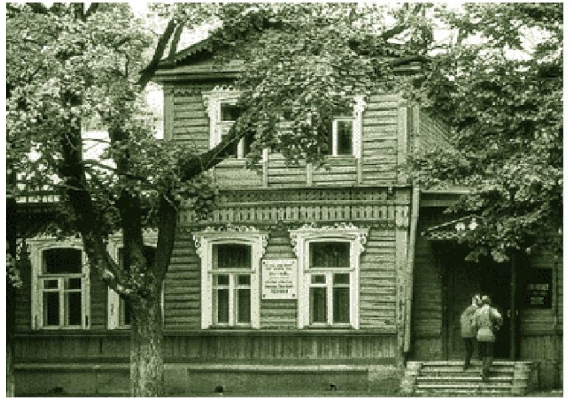
Дом, где родился писатель.

Николай Семёнович Лесков родился 4 февраля 1831 года в селе Горохово Орловского уезда. Именно здесь