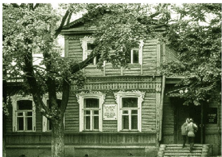
Дом, где родился писатель.