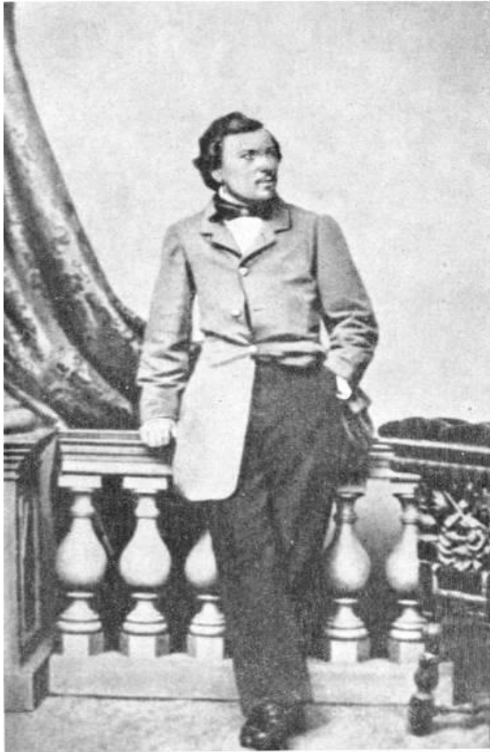
Н. С. Лесков. Портрет В. Серова.

Лесков переведен в Киев чиновником казенной палаты. В доме дяди, брата матери, профессора медицины, под влиянием прогрессивных университетских профессоров пробудился горячий интерес Лескова к Герцену, к великому поэту Украины Тарасу Шевченко, к украинской культуре, он увлекся старинной живописью и архитектурой Киева, став в дальнейшем выдающимся знатоком университета, изучал польский язык, древнего русского искусства. увлекся иконописью, принимал участие в религиозно-философском студенческом кружке, общался с паломниками, старообрядцами, сектантами.