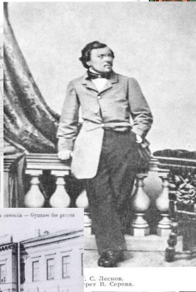
С. Лесков. рет. В. Серова.