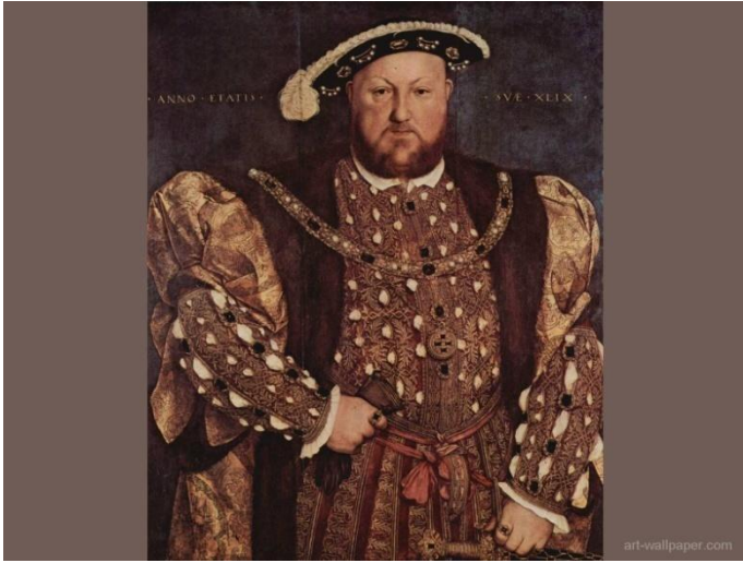
Генрихе VIII 1491—1547

«Звездная палата» – чрезвычайный суд по борьбе с английской аристократией и противниками англиканской церкви.