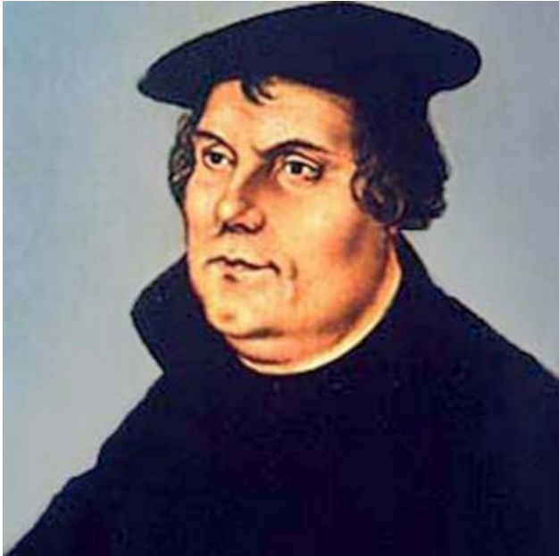
М. Лютер. 1483- 1546,

31 октября 1517 г. - признан "Днем Реформации"