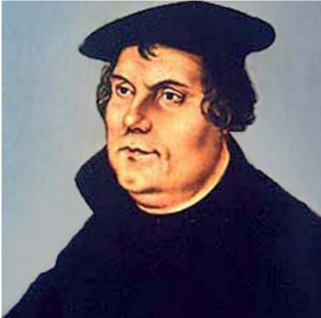
М. Лютер. 1483- 1546,

31 октября 1517 г. - признан "Днем Реформации"