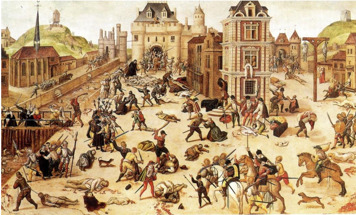
Варфоломеевская ночь 1572 г.

Приехавшие в Париж на свадьбу гугеноты были вероломно перебиты в ночь на 24 августа 1572 года, получившей название Варфоломеевской . Убийства гугенотов были организованы католиками и в других городах Франции. В Париже погибло более 3 тысяч гугенотов. Среди убитых был и адмирал Колиньи. Всего по стране убито более 20 тыс.