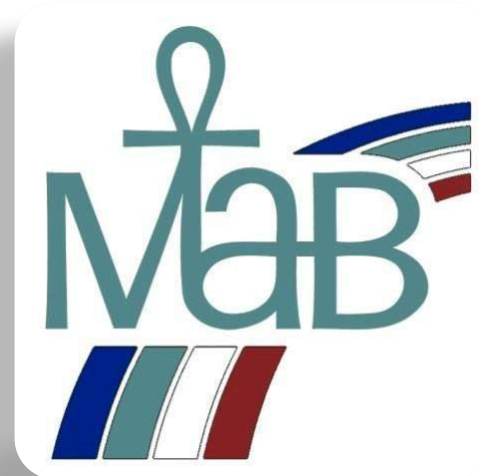
Международная программа ЮНЕСКО «Человек и биосфера».