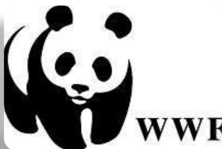
Всемирный фонд охраны природы