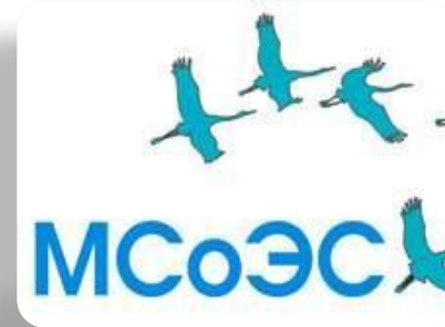
Международный социально – экологический союз