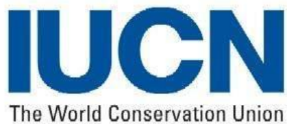
Международный союз охраны природы и природных ресурсов