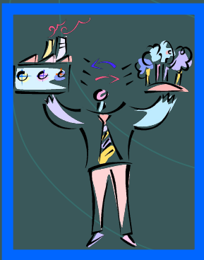
Ответственность перед обществом и людьми