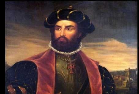
Васко да Гама