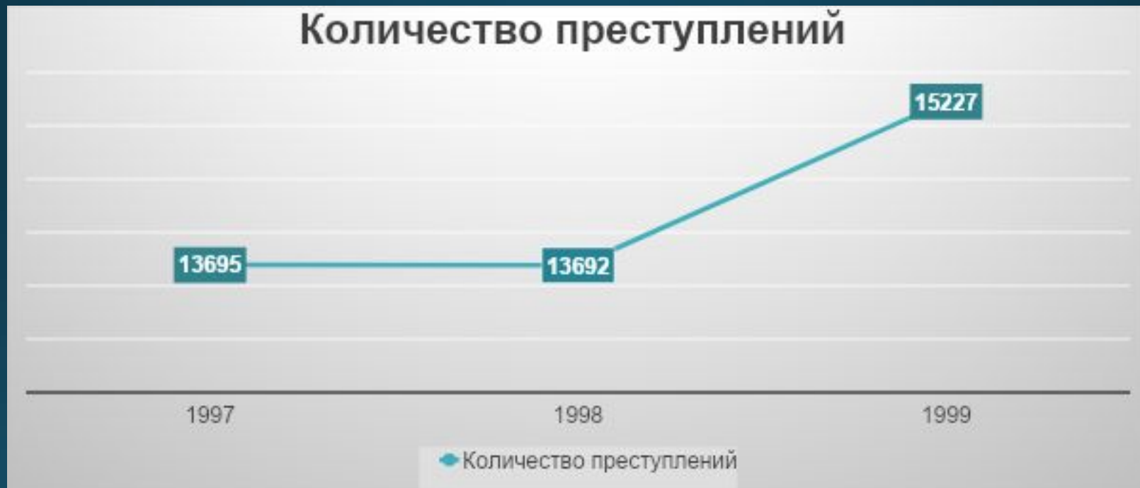
График динамики преступности в Рязанской области в 1997 – 1999 годах