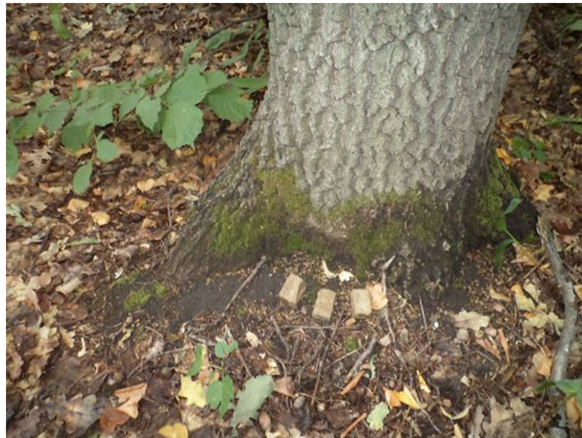
Брикеты вакцины «РАБИСТАВ». Фото было сделано 15 июня 2020 г., 11:15.