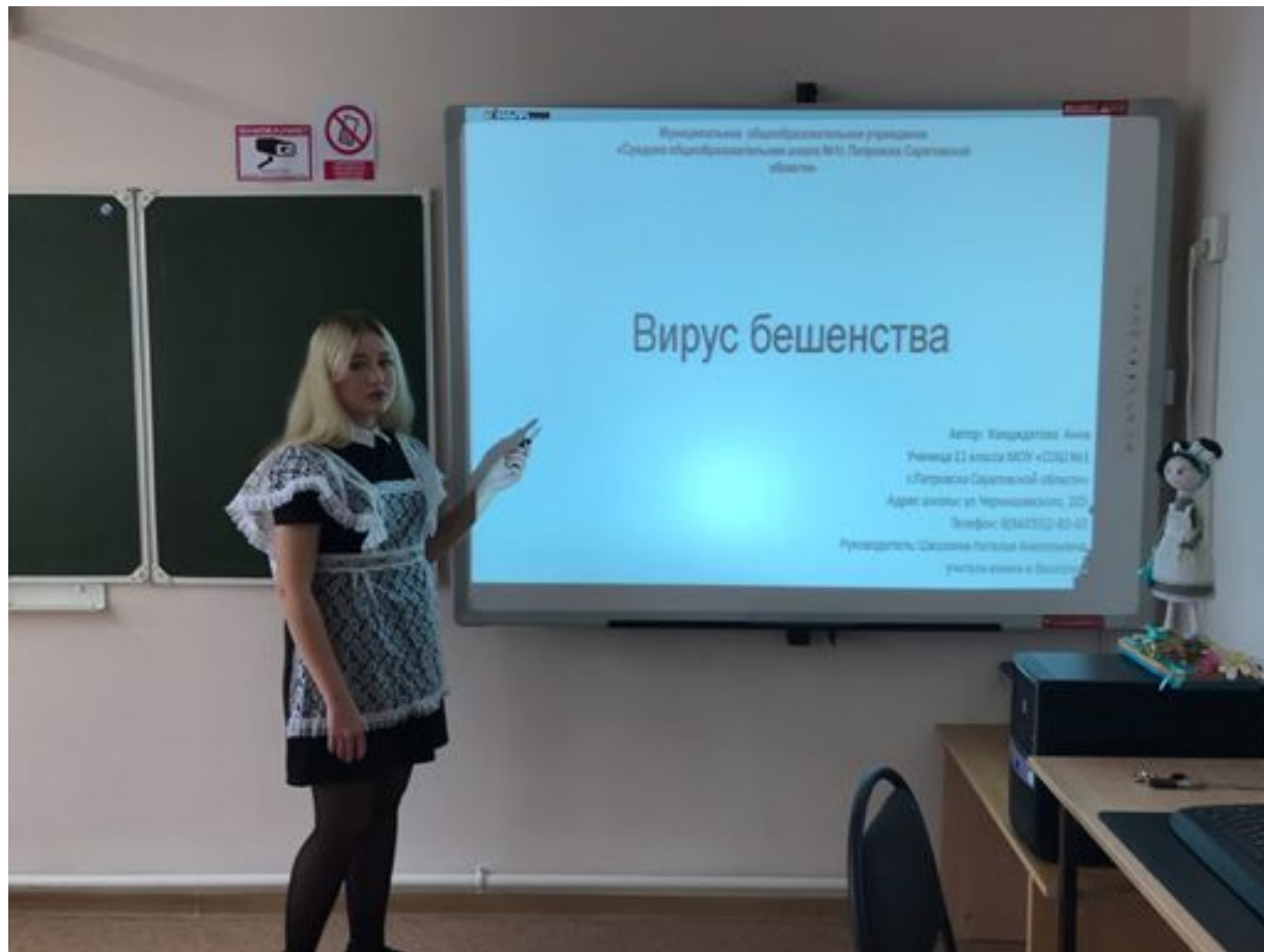
Проведение классного часа в 11 классе на тему: «Вирус бешенства». Фото было сделано 21 октября 2020г, 14:07.