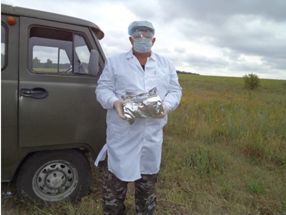
Охотовед Петровского района раскладывает оральную вакцину против бешенства для диких животных. Фото было сделано 15 июня 2020 г., 11:08.