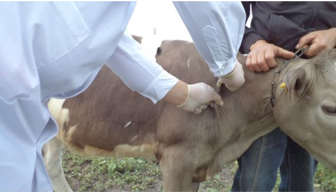
Вакцинация крупного рогатого скота (крс) против бешенства. Вакцина «РАБИКОВ». Фото было сделано 23 июня 2020 г., 10:18.