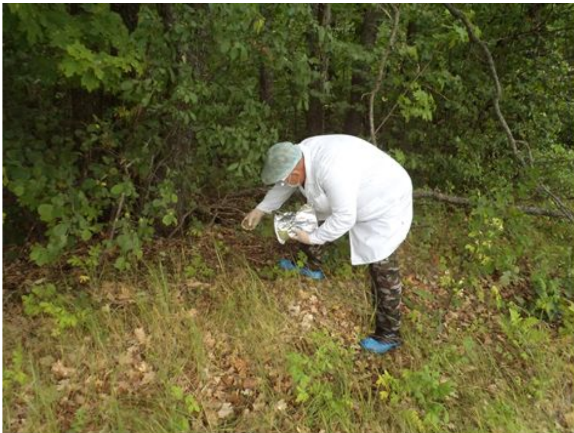
Охотовед Петровского района раскладывает оральную вакцину против бешенства для диких животных вокруг лисьей норы. Фото было сделано 15 июня 2020 г., 11:13.