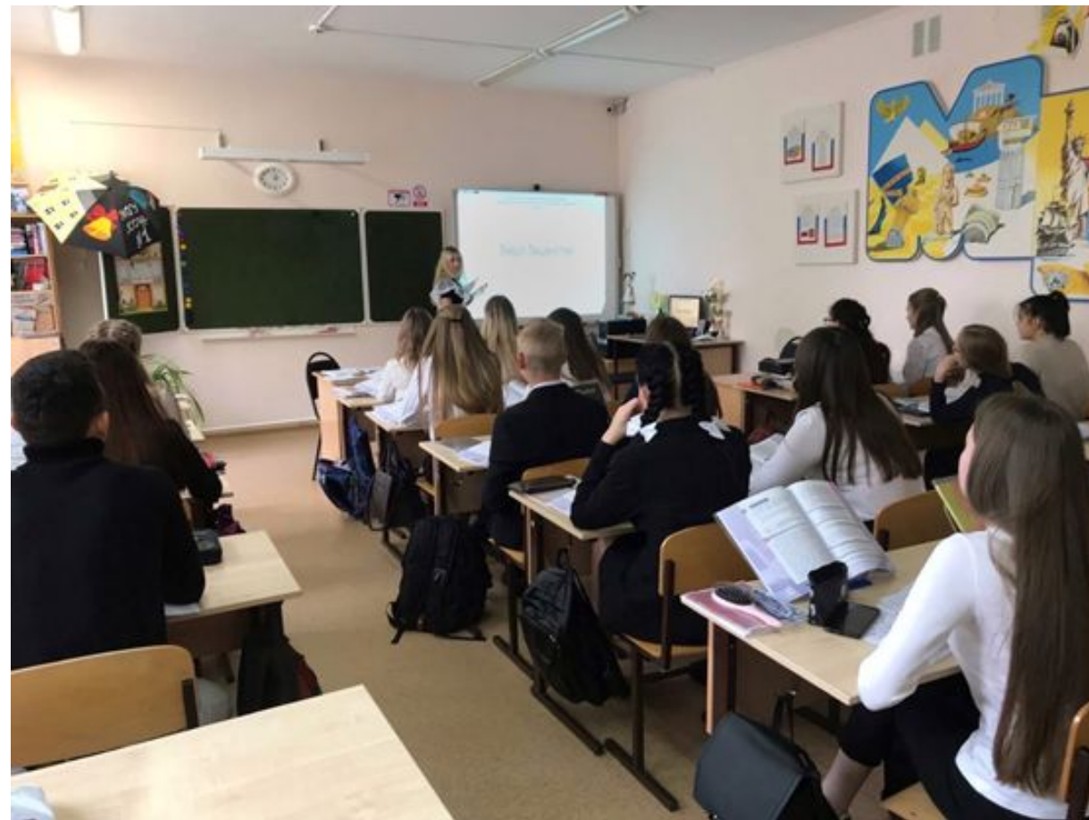
Проведение классного часа в 11 классе на тему: «Вирус бешенства». Фото было сделано 21 октября 2020г, 14:07.