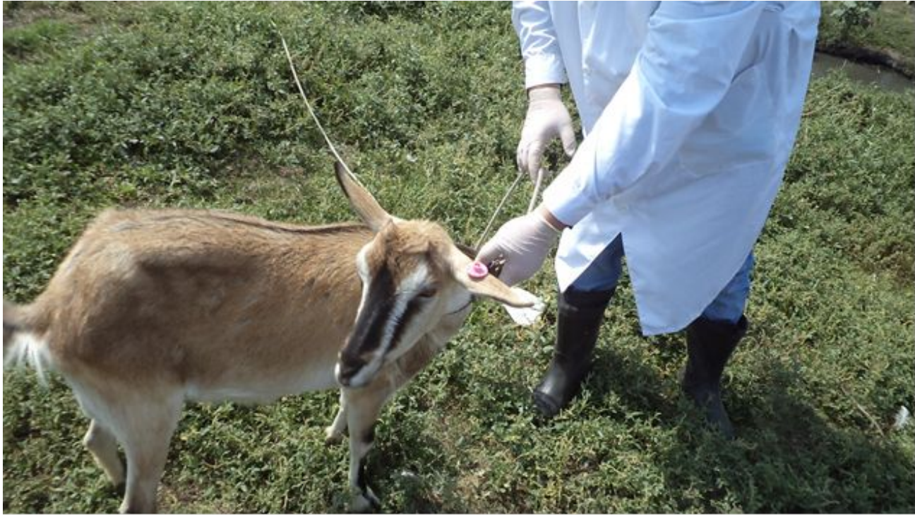
Вакцинация мелкого рогатого скота (мрс) против бешенства. Вакцина сухая «ЩЁЛКОВО-51». Фото было сделано 23 июня 2020 г., 10:23. Фото было сделано 30 июля 2020 г., 20:15.