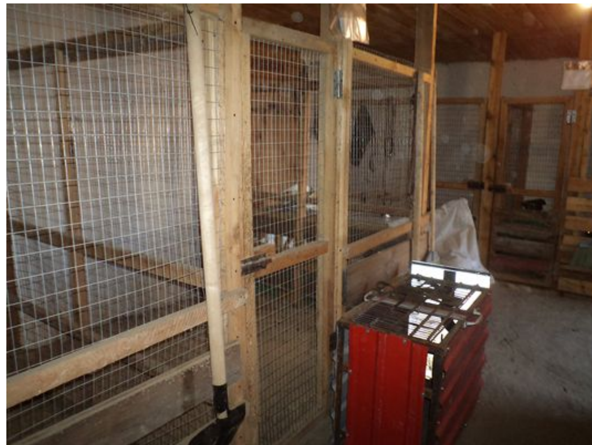
Пункт передержки беспризорных животных в г. Петровске. Фото было сделано 30 июня 2019 г., 15:13.