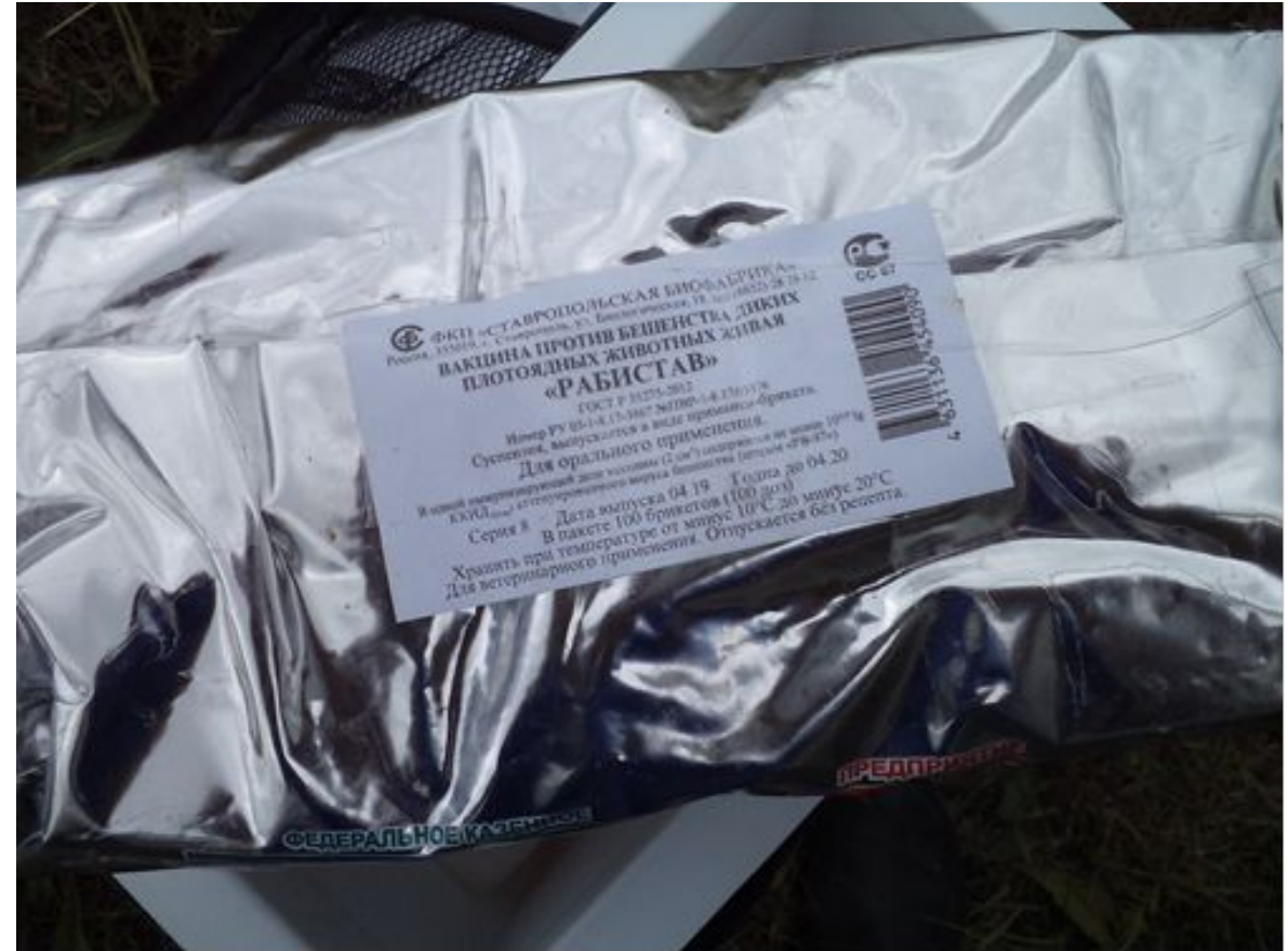
Вакцина против бешенства диких плотоядных животных живая «РАБИСТАВ». Фото было сделано 15 июня 2020 г., 11:11.