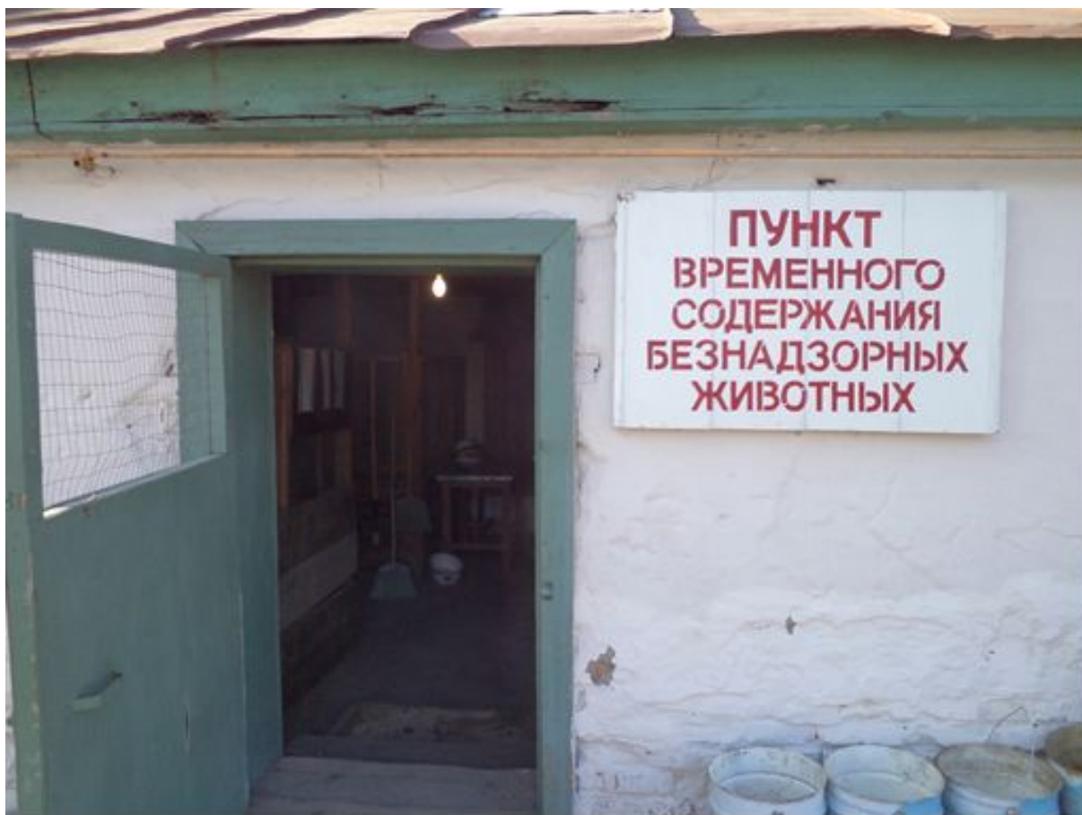
Вход в пункт временного содержания безнадзорных животных. Фото было сделано 30 июня 2020 г., 15:13.