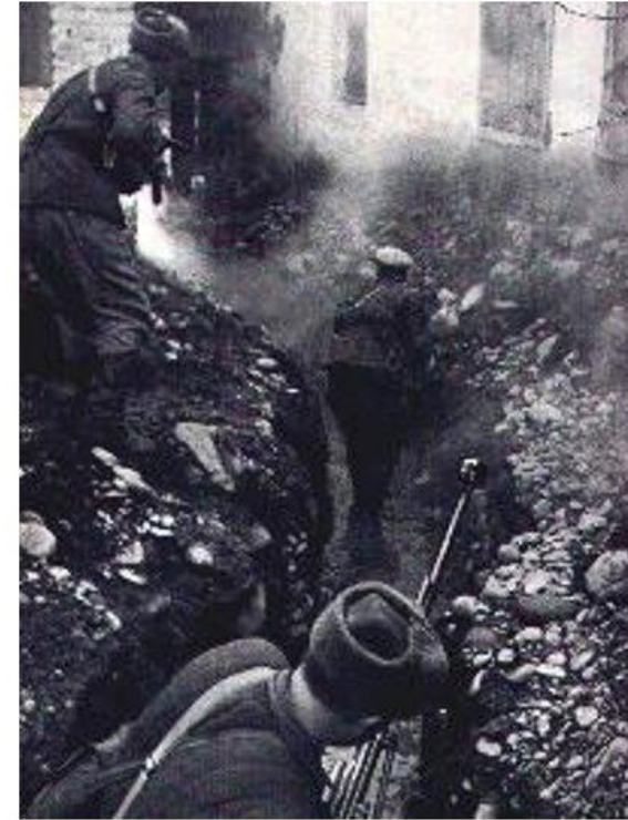
Бой за Моздок. Сентябрь 1942