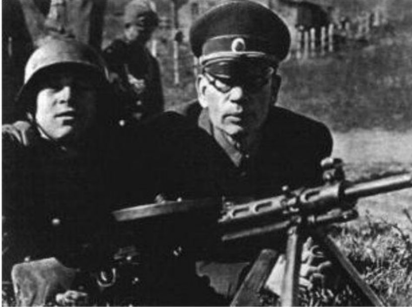
Генерал Власов на учениях вермахта. 1943 г.

Вооруженную борьбу против Советской власти вели Украинская повстанческая армия, Крымский мусульманский комитет и Особая партия кавказских братьев. В 1943 г. возникла Русская освободительная армия ген. Власова, сформированная из военно пленных. Немцы стремились поставить национальные движения под свой контроль и ставили во главе их бывших белых генералов. Но население эти организации не поддержало.