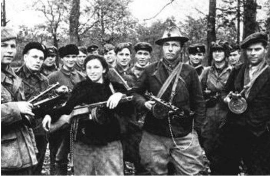
Партизанский отряд в Приднестровье. Апрель 1943 г.

Дружба людей разных национальностей помогла при защите Москвы, Ленинграда, Севастополя и т.д. Среди 11 тысяч героев СССР (в годы войны), были представители почти всех народов нашей страны. На территории Украины и Белоруссии в партизанских отрядах воевали люди 70-и национальностей. Дружба народов стала одним из источников нашей Победы.