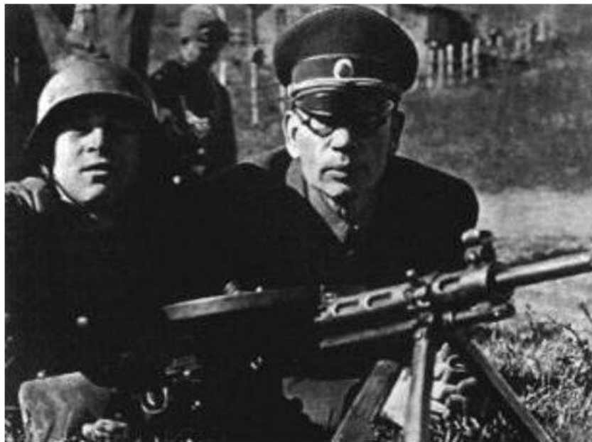
Генерал Власов на учениях вермахта. 1943 г.

Вооруженную борьбу против Советской власти вели Украинская повстанческая армия, Крымский мусульманский комитет и Особая партия кавказских братьев. В 1943 г. возникла Русская освободительная армия ген. Власова, сформированная из военно пленных. Немцы стремились поставить национальные движения под свой контроль и ставили во главе их бывших белых генералов. Но население эти организации не поддержало.