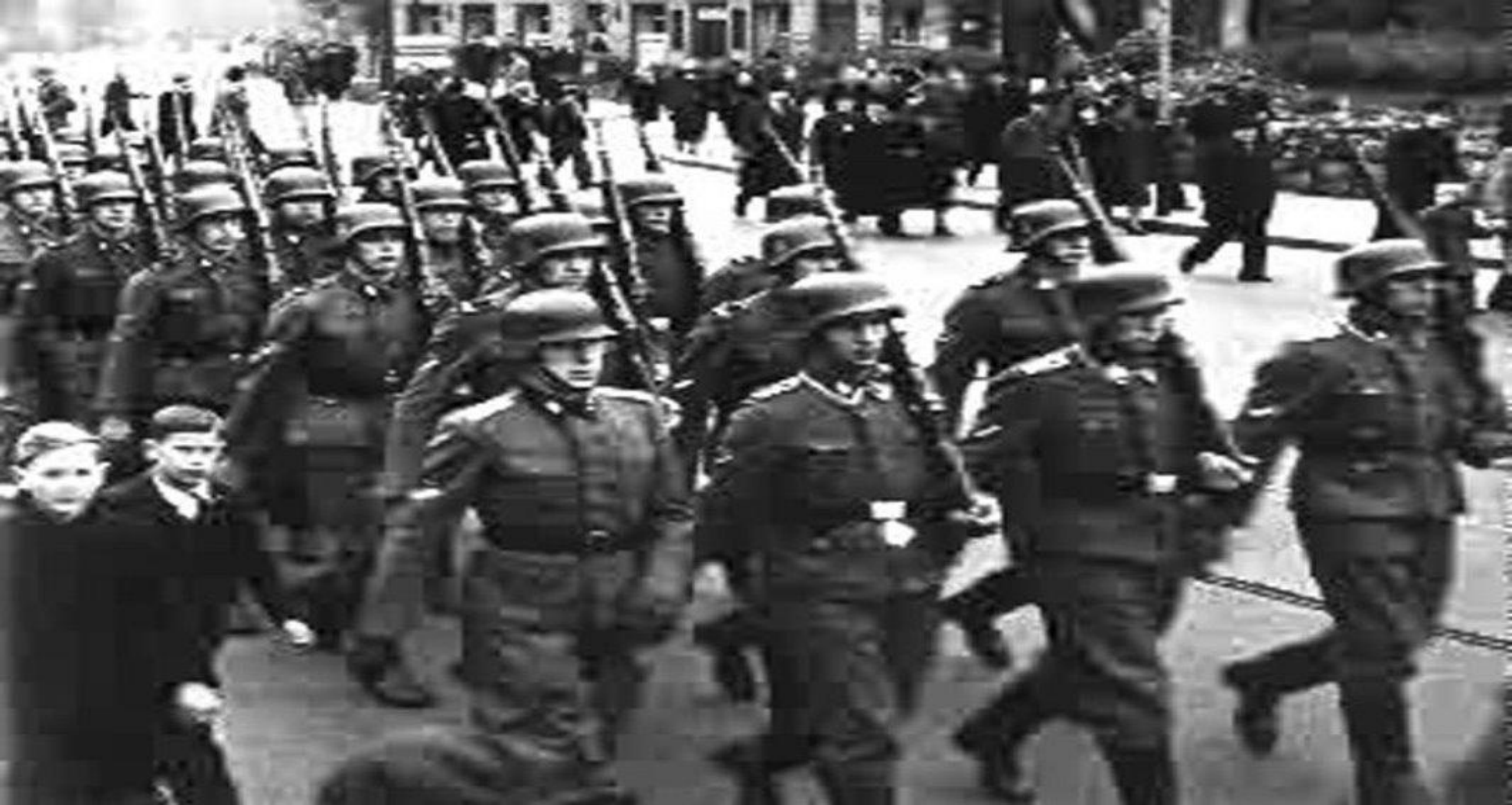
Легион латышских националистов «Латышские стрелки» на параде в Риге.