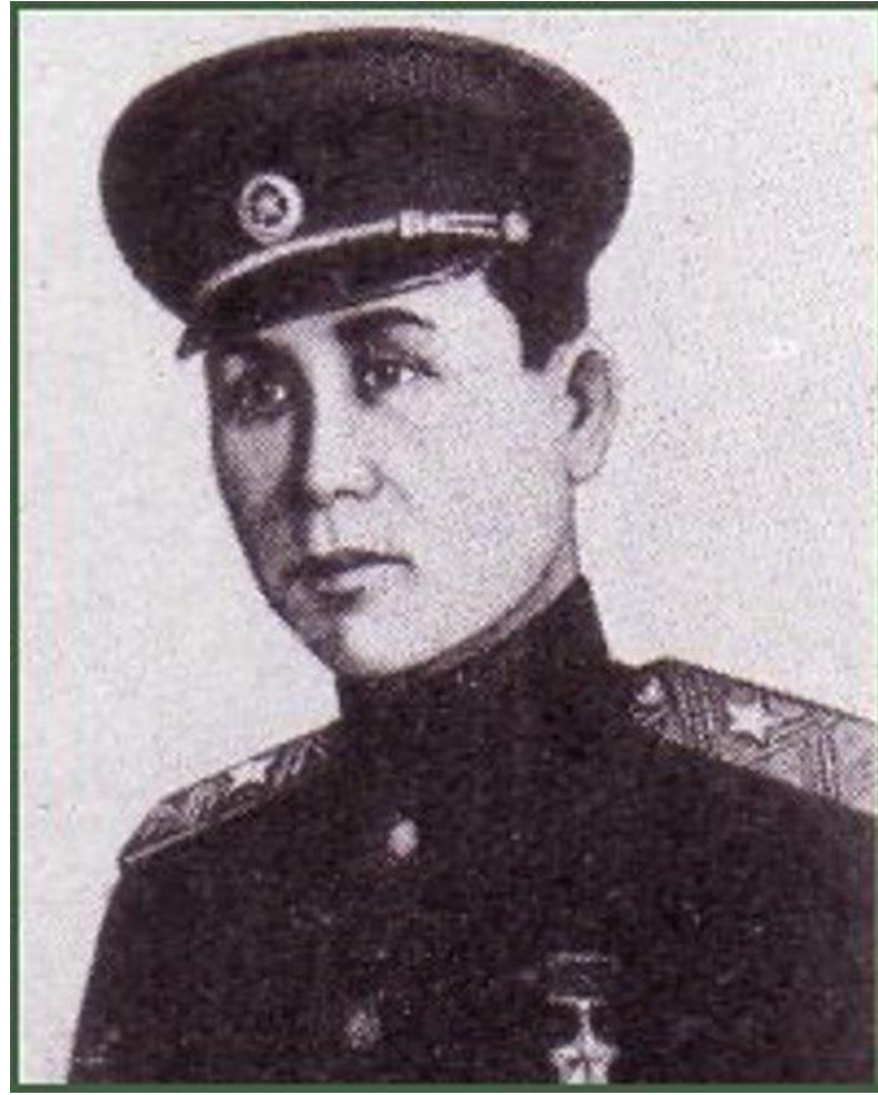
Гвардии генерал-майор, Герой Советского Союза Сабир Рахимов, командующий армией Белорусского фронта.