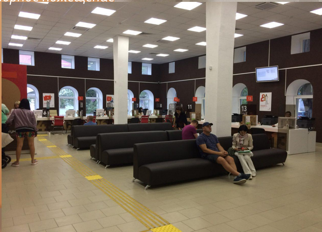
Центр «Мои Документы» г. Феодосия