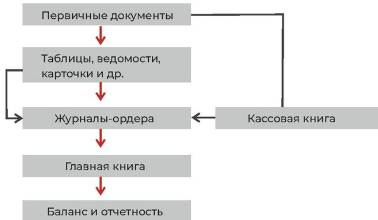
Схема бухгалтерского учета

В нем отражаются активы и пассивы предприятия.