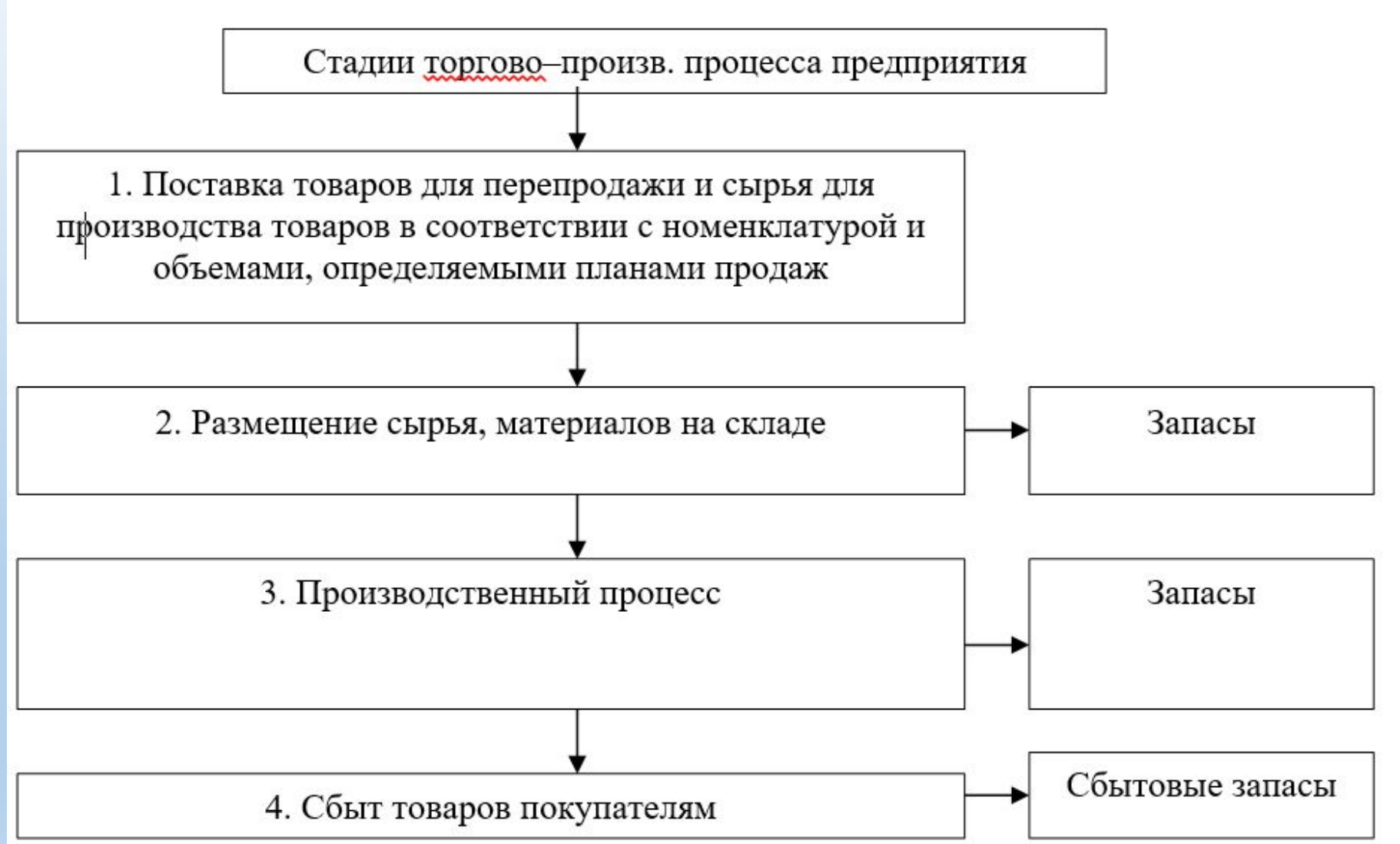
Схема технологического процесса в ООО «Универсалстрой-НЧ»