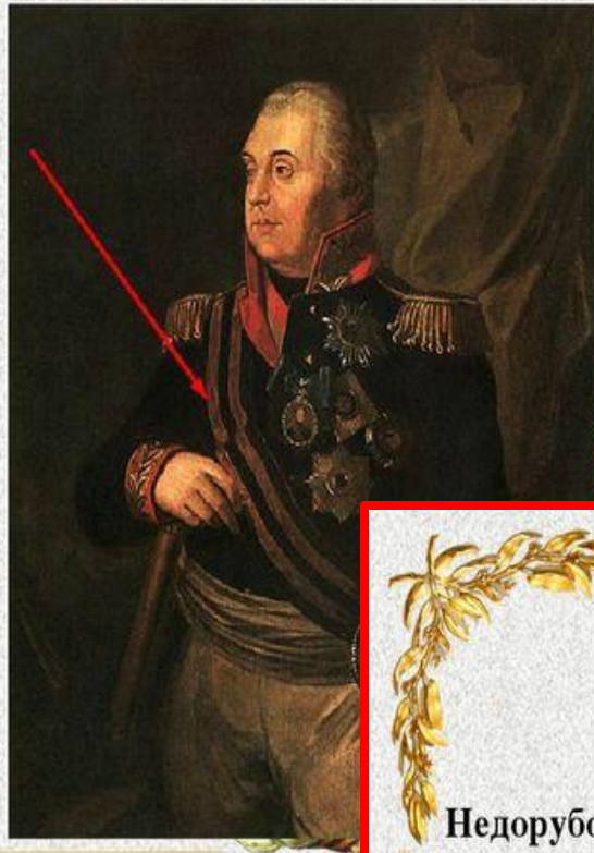
М. И. Кутузов, первый полный кавалер ордена Святого Георгия, в Георгиевской ленте