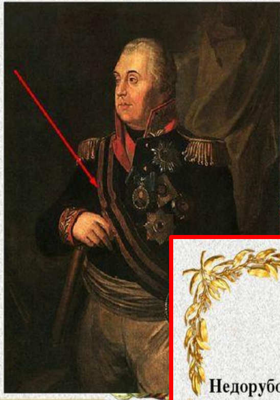
М. И. Кутузов, первый полный кавалер ордена Святого Георгия, в Георгиевской ленте