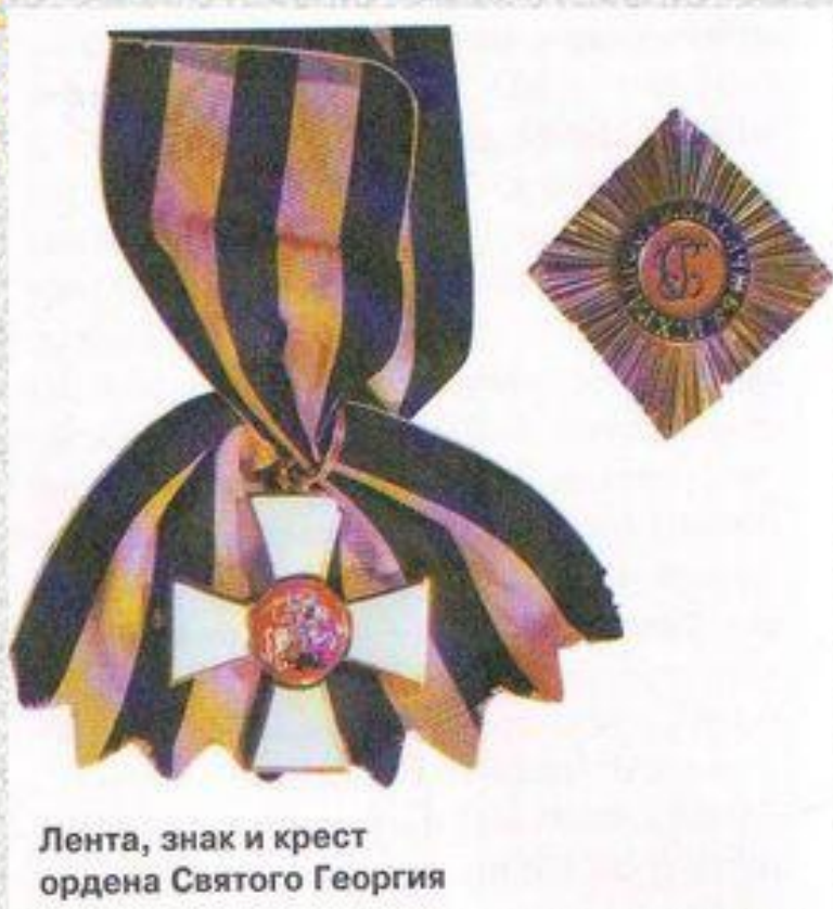
Лента, знак и крест ордена Святого Георгия

В России очень любили и почитали святого великомученика Георгия. Поэтому дали его имя самому почетному военному ордену. Этим орденом награждались только офицеры и генералы за личные боевые заслуги.