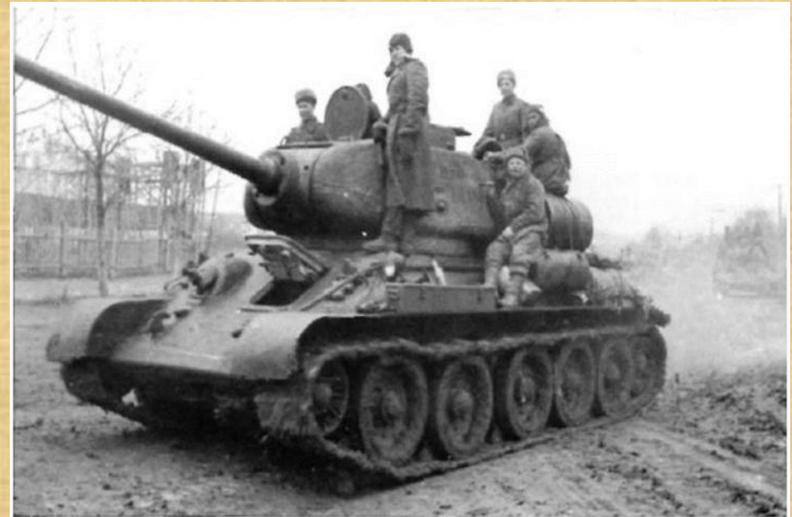
Concord-Russian Medium tanks 1941-1945 (page 47)