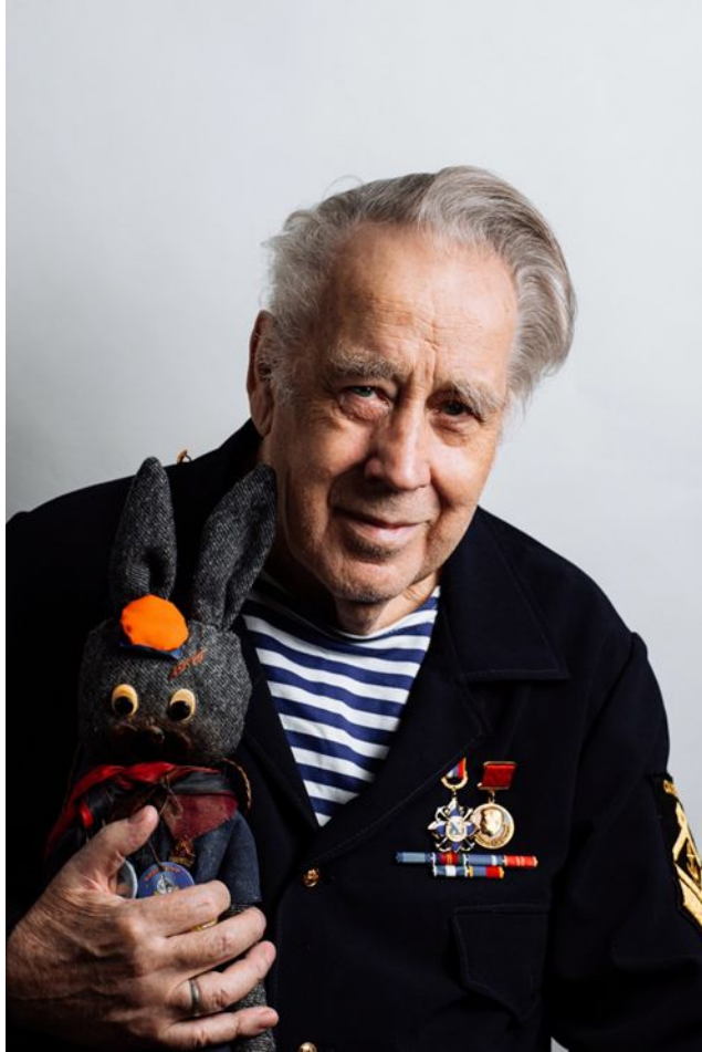
Крапивин Владислав Петрович (1938-2020)