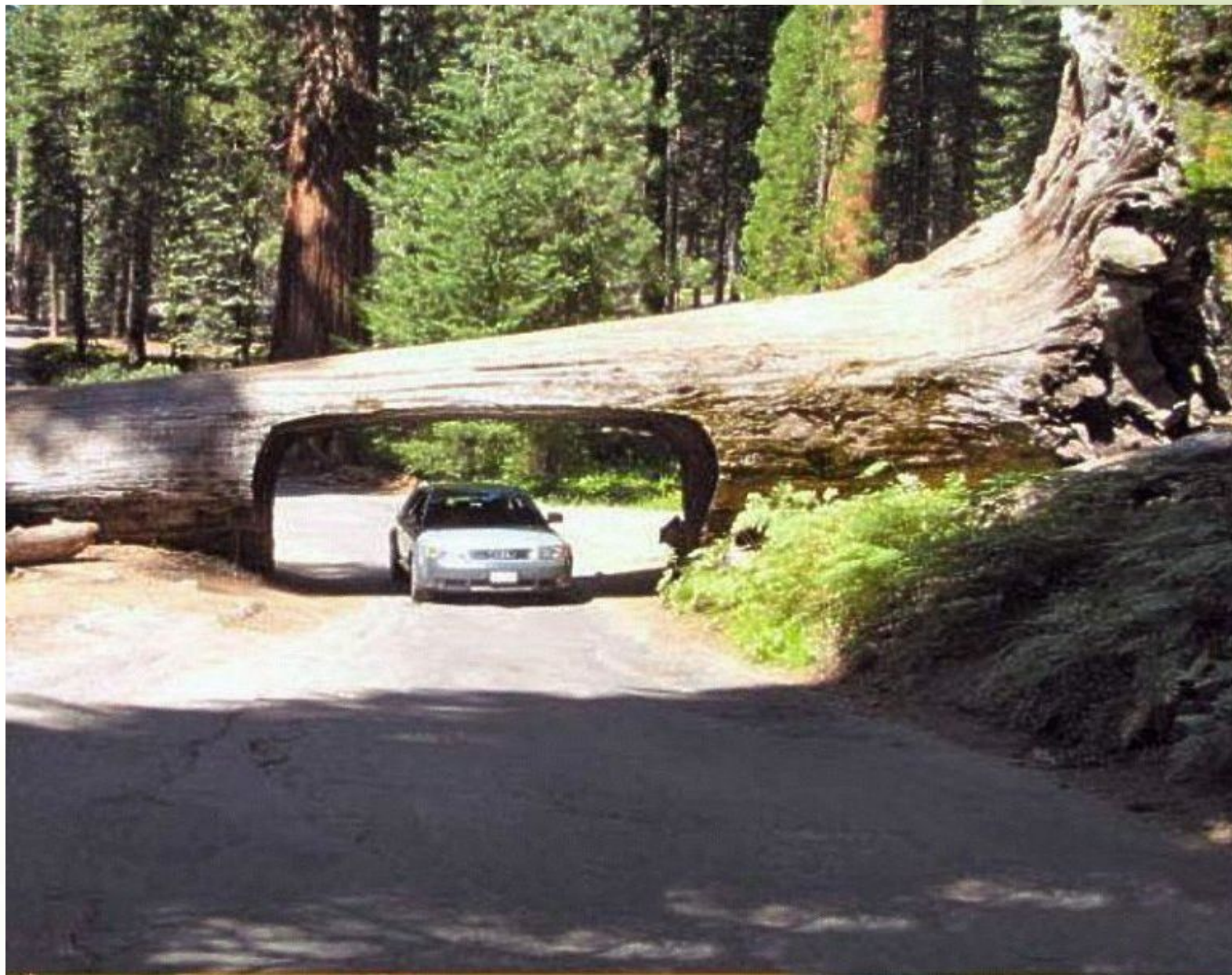
МБОУ Лицей №1 городского округа город Мантурово Костромской области