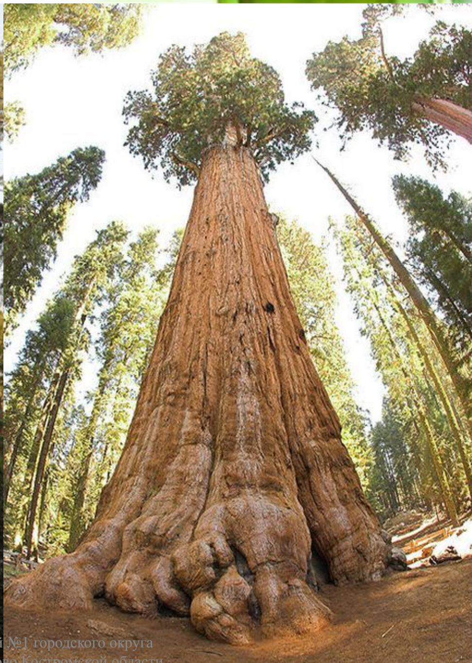
МБОУ Лицей №1 городского округа город Мантурово Костромской области