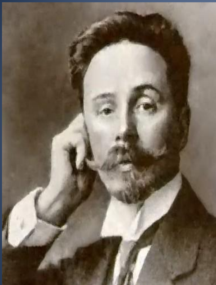
Александр Николаевич Скрябин (1871/1872—1915)