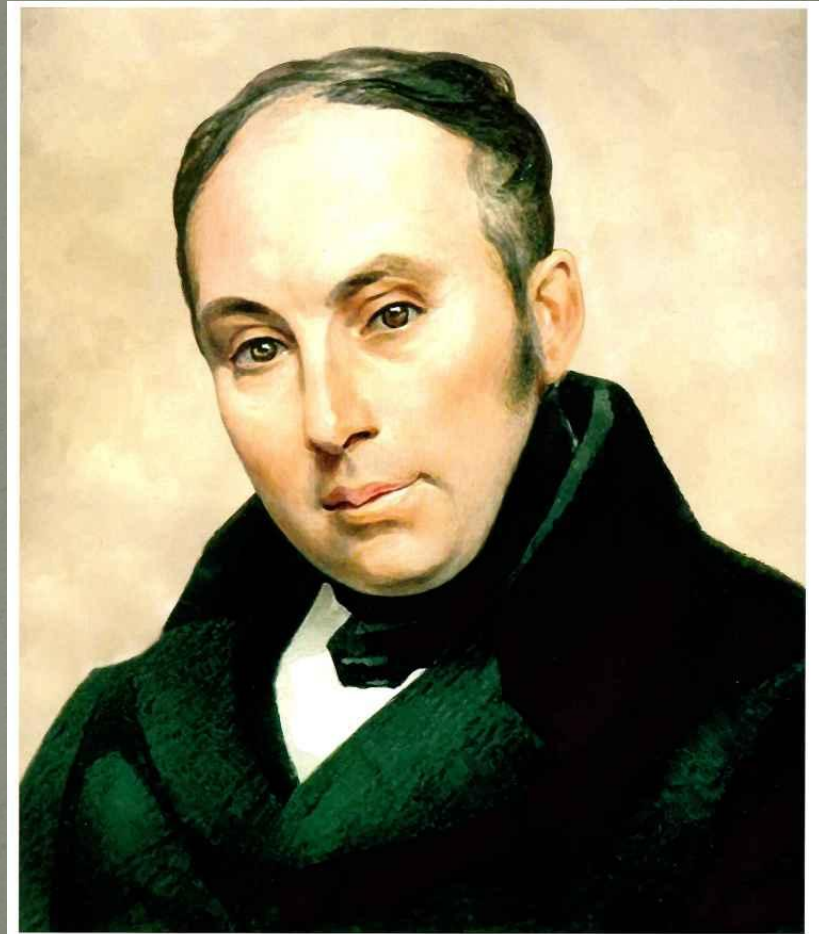
Василий Андреевич Жуковский