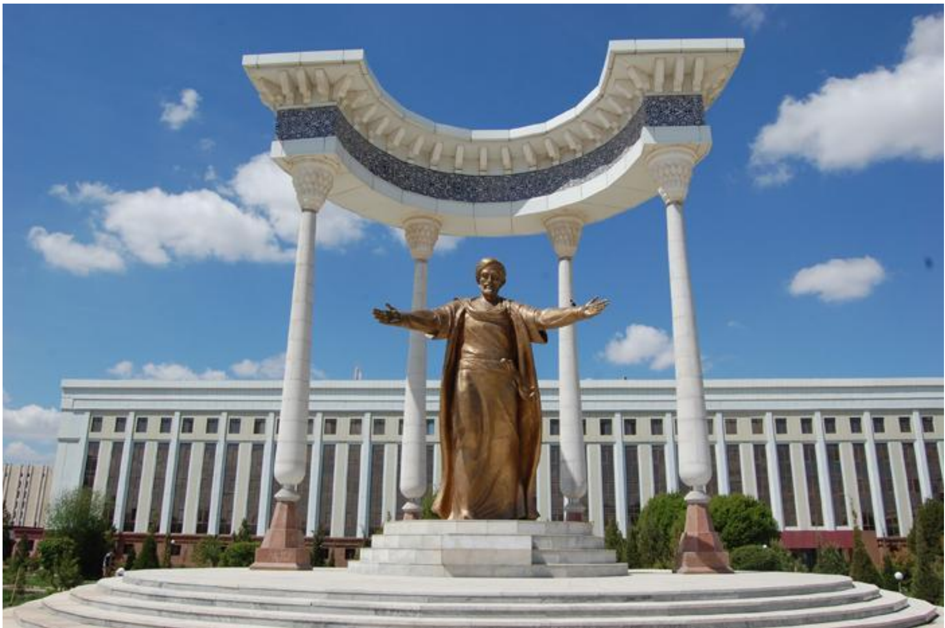
● Памятник аль-Хорезми в Хиве