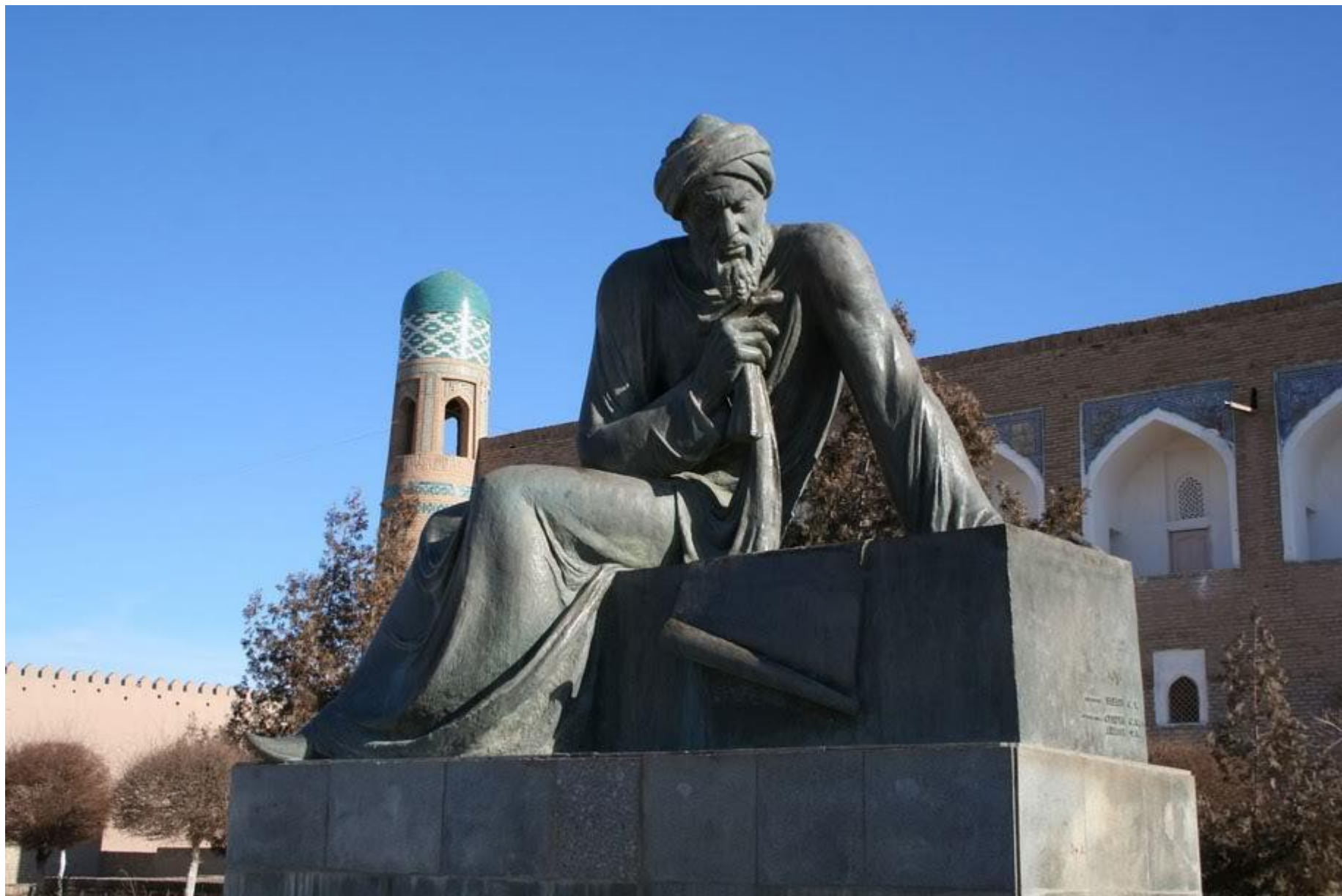
● Памятник аль-Хорезми в Узбекистане