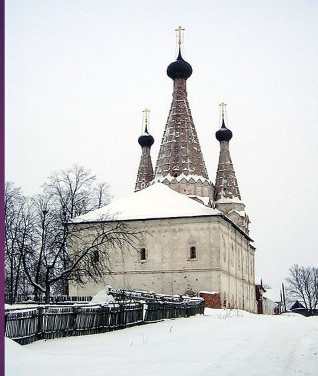
Успенская Дивная церковь на территории Алексеевского монастыря в Угличе