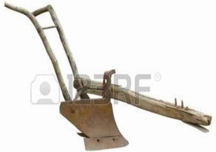
Плуг старого образца

Распространено было в лесостепной зоне. В лесной же преобладало подсечно-огневое земледелие.