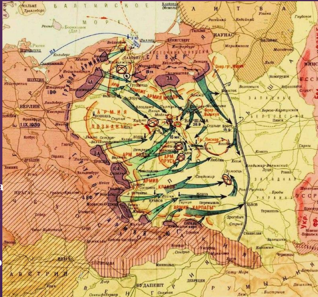
Бойові дії вермахту в Польщі

У цей час Третій рейх уже завершив підготовку до війни. Навіть не проводячи мобілізації, він зумів зосередити на польському кордоні три групи армій чисельністю 1,8 мільйона чоловік, на озброєнні яких було 2800 танків, близько 3 тисяч літаків і 10 тисяч гармат. Удар планувалось завдати з трьох напрямків: північного зі Східної Пруссії, із заходу з Померанії та південного заходу з Сілезії і за підтримки з півдня силами 50-тисячної словацької армії. Метою усіх трьох ударів була Варшава, яку планувалось взяти за два тижні, після чого належало знищити рештки витісненої на захід від Вісли польської армії.