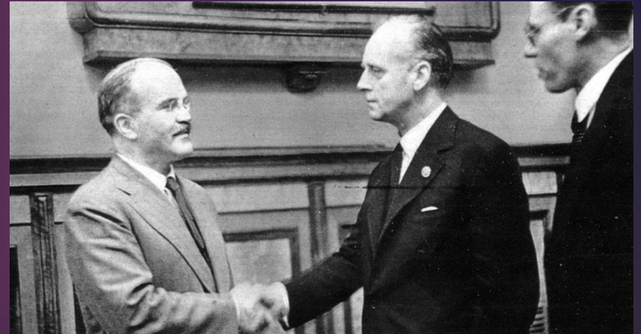
Підписання Пакту про ненапад між Німеччиною і СРСР

Напередодні Другої світової війни СРСР опинився в центрі міжнародних відносин. Від його позиції залежав їх подальший хід. Прихильності СРСР домагалися як Англія з Францією, так і Німеччина. Перед радянським керівництвом стала проблема остаточного вибору орієнтира.