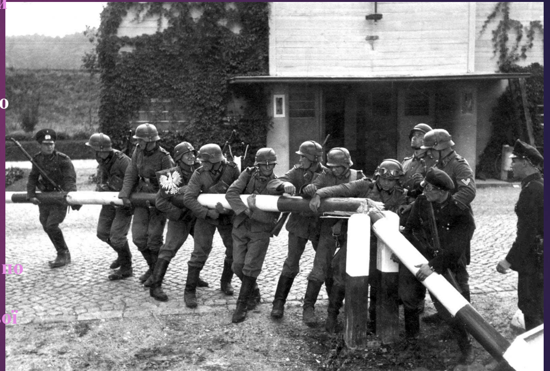
Солдати Вермахту і митники Вільного міста Данциг ламають шлагбаум на кордоні з польським Сопотом, 1 вересня 1939 року

4 вересня війну Німеччині оголосив Ньюфаундленд, 6 вересня Південно-Африканський Союз, 10 вересня — Канада.