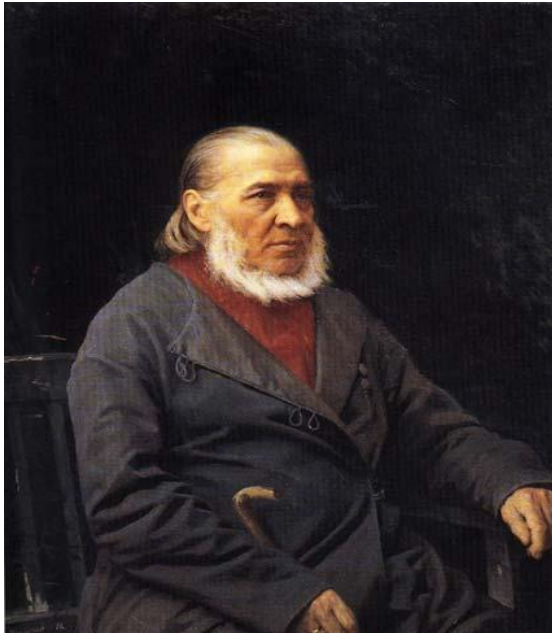
Сергей Тимофеевич Аксаков

В Самаре жил дед писателя С. М. Аксаков, бывал и сам писатель С. Т. Аксаков, но в наибольшей степени с нашим городом связана жизнь его сыновей – Григория Сергеевича и Ивана Сергеевича Аксаковых.