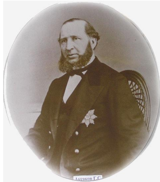
Григорий Сергеевич Аксаков