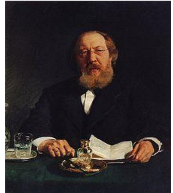
Иван Сергеевич Аксаков

170-летию Самарской губернии посвящается