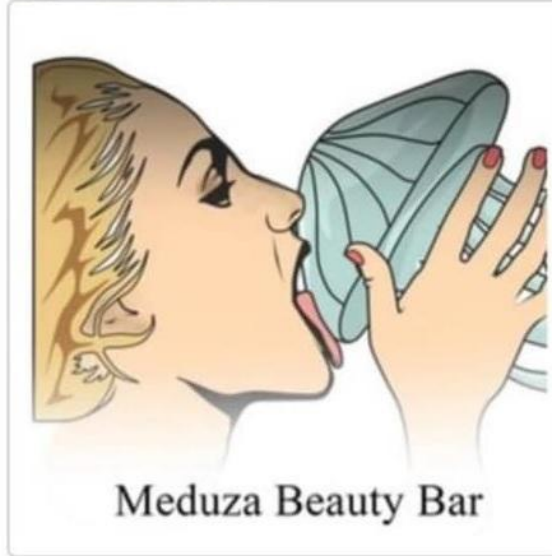
(540) Зображення знака