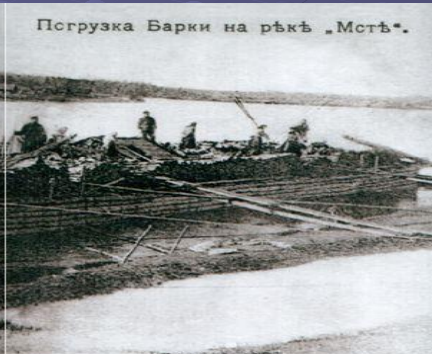
Погрузка Барки на рѣкѣ „Мстѣ“.

Грузовое движение по Мсте-реке в 18 - первой половине 19-века осуществлялось в основном речными плоскодонными судами - барками, грузоподъемностью от 98 до 131 тонны. Весенний караван барок перевозил сало, масло, пеньку, лен, мануфактуру; летний - хлеб; осенний - металл. За навигацию по Мсте проходило до 6 тысяч барок. После появления железнодорожного сообщения количество судов значительно уменьшилось.