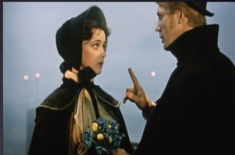
Белые ночи 1959