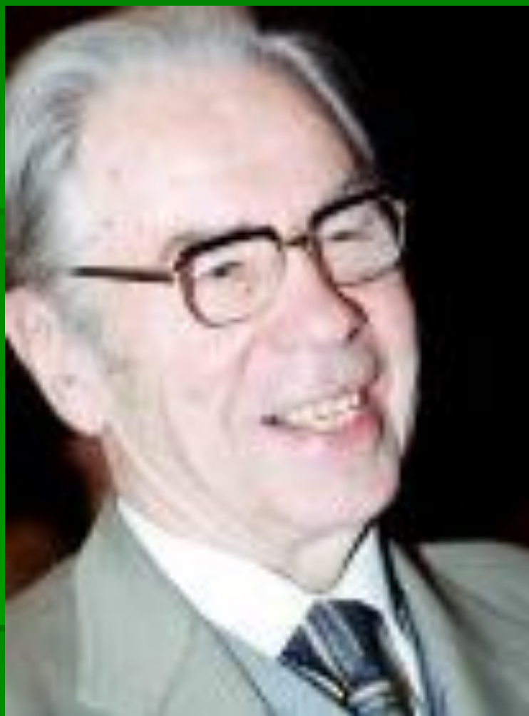
Ф.Л. Решетников 1906-1988