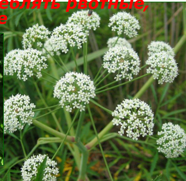
Cicuta virosa