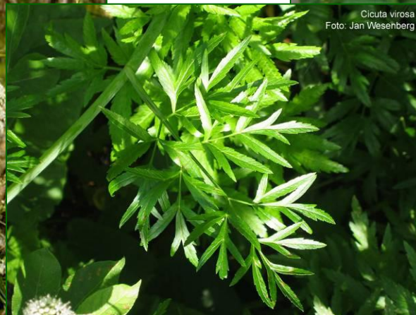
Cicuta virosa