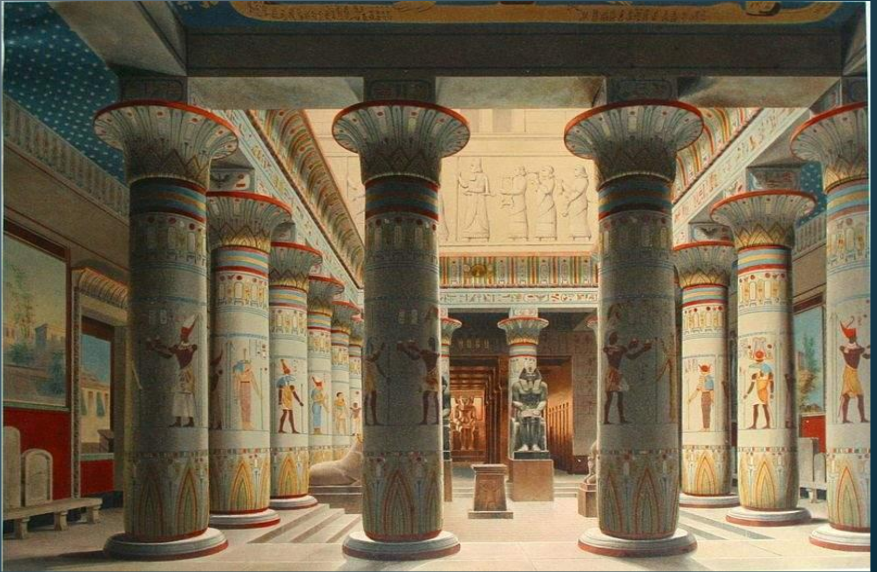
Ägyptischer Hof des Neuen Museums.