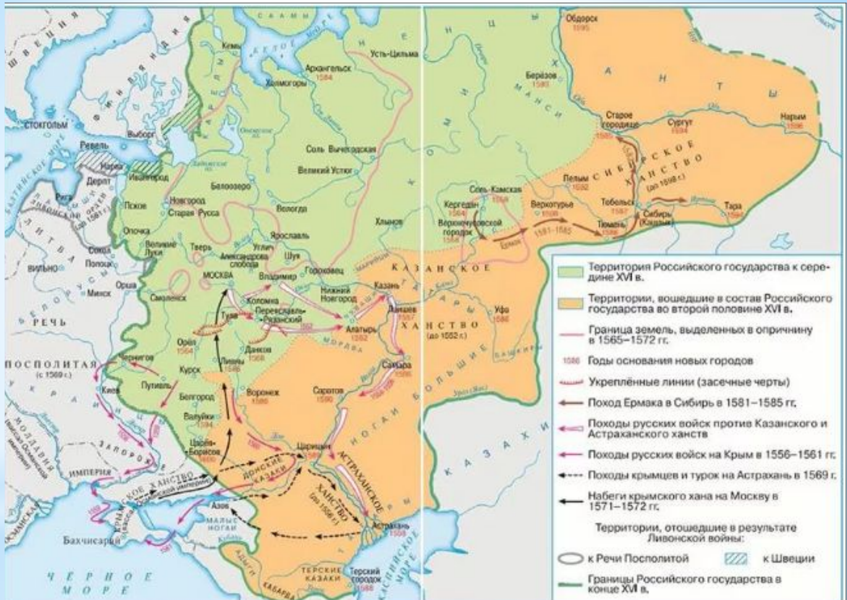
Российское государство во второй половине 16 века