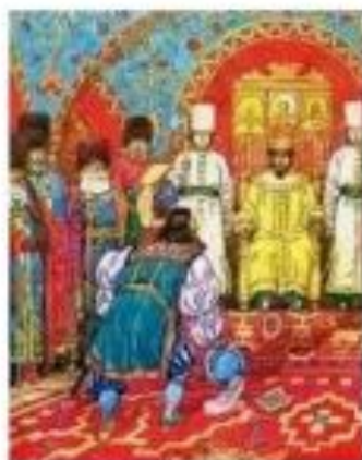
Иван Висковатый, дьяк Посольского приказа