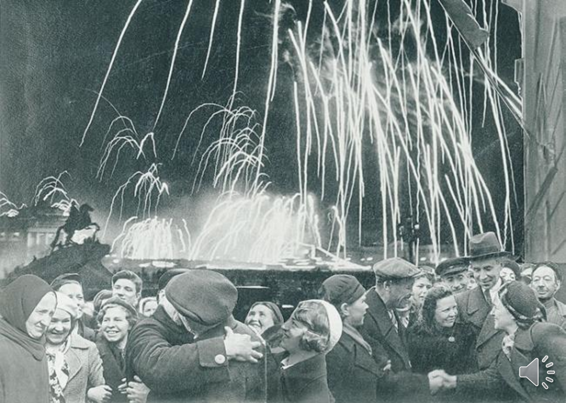
-ВЕЛИКАЯ ПОБЕДА ОДЕРЖАНА СОВЕТСКИМИ ВОЙСКАМИ ПОД ЛЕНИНГРАДОМ: