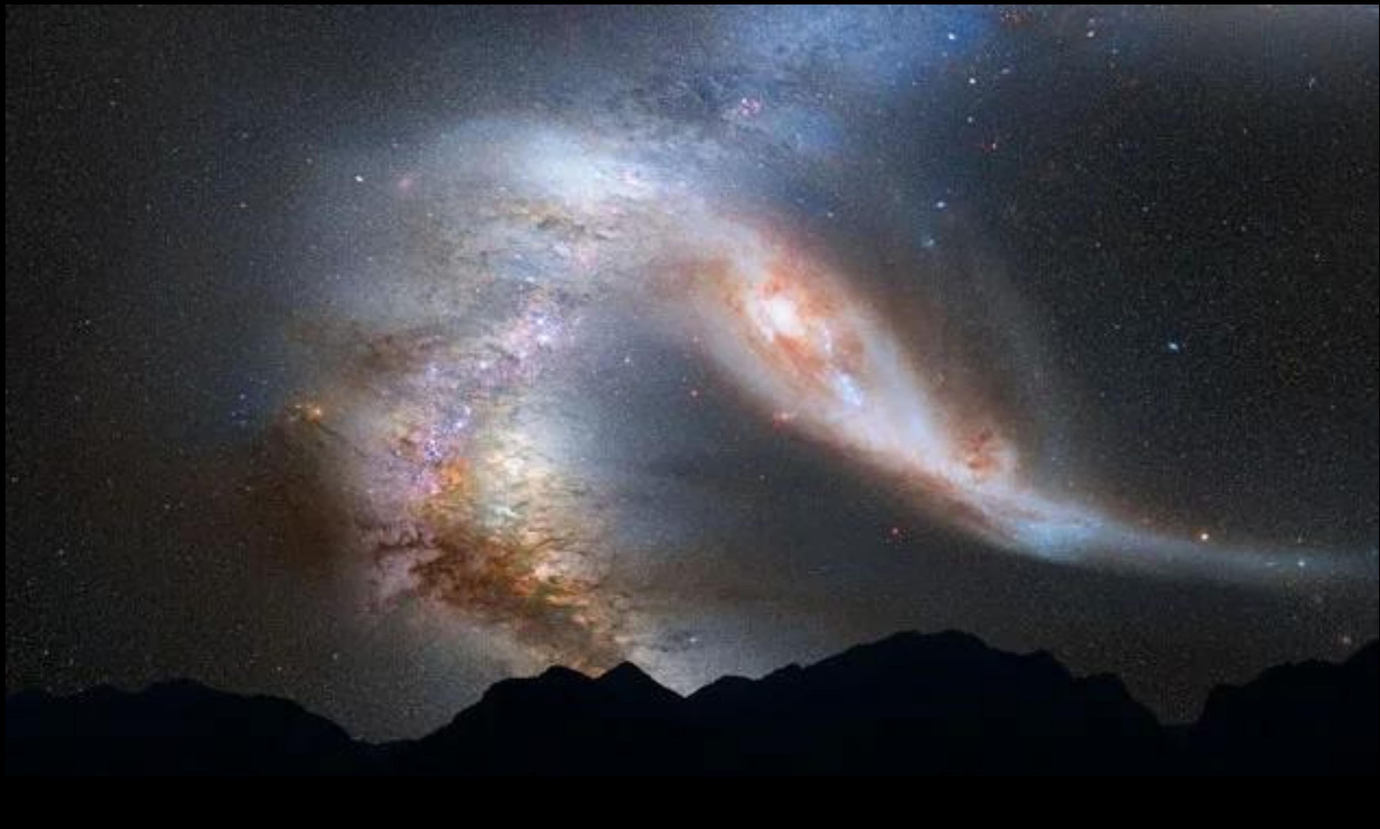
пример слияния двух галактик, по мнению NASA