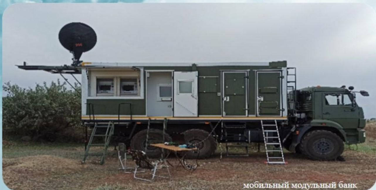
мобильный модульный банк