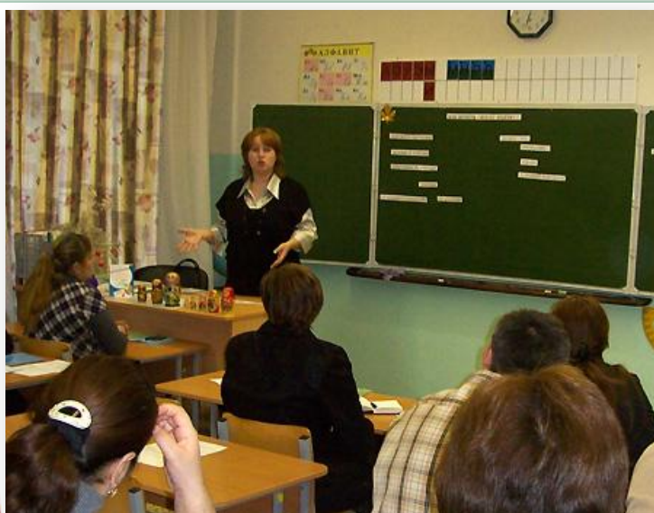
Проведение родительского собрания в 16 классе Моу СОШ № 15 г. Азова