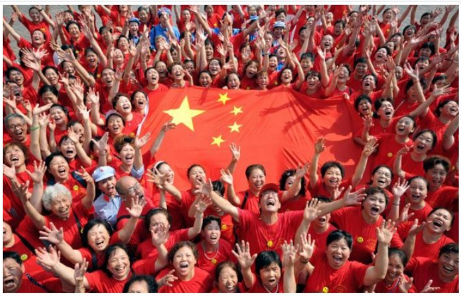
Лукашенко просит китайцев увеличить инвестиции в Беларусь.

Приглашая китайских бизнесменов вкладывать деньги в белорусскую экономику, власти не осознают реальную угрозу китаизации Беларуси.