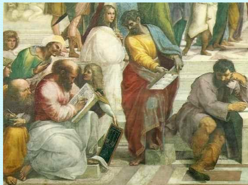
Боэций (слева) на фреске Рафаэля «Афинская школа»