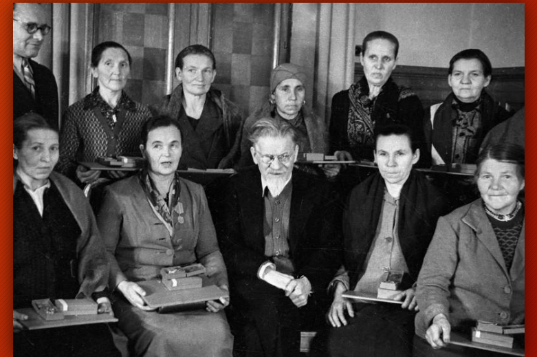
Первые матери-героини на приеме у председателя президиума Верховного Совета СССР Михаила Калинина, 1944 год

К лету 1944 года война с гитлеровской Германией по всем фронтам переместилась за пределы границ Советского Союза. Еще повсюду шли кровопролитные бои, но победа была очевидной, как и многомиллионные человеческие потери, которые страна понесла за годы Второй мировой. Для поддержки женщин и выхода из демографического кризиса требовались срочные меры. Женщин решили наградить, поддержать и стимулировать к рождению и воспитанию новых детей. 8 июля 1944 года вышел Указ «Об увеличении государственной помощи беременным женщинам, многодетным и одиноким матерям, усилении охраны материнства и детства, об установлении почетного звания “Мать-героиня” и учреждении ордена “Материнская слава” и медали “Медаль материнства”».