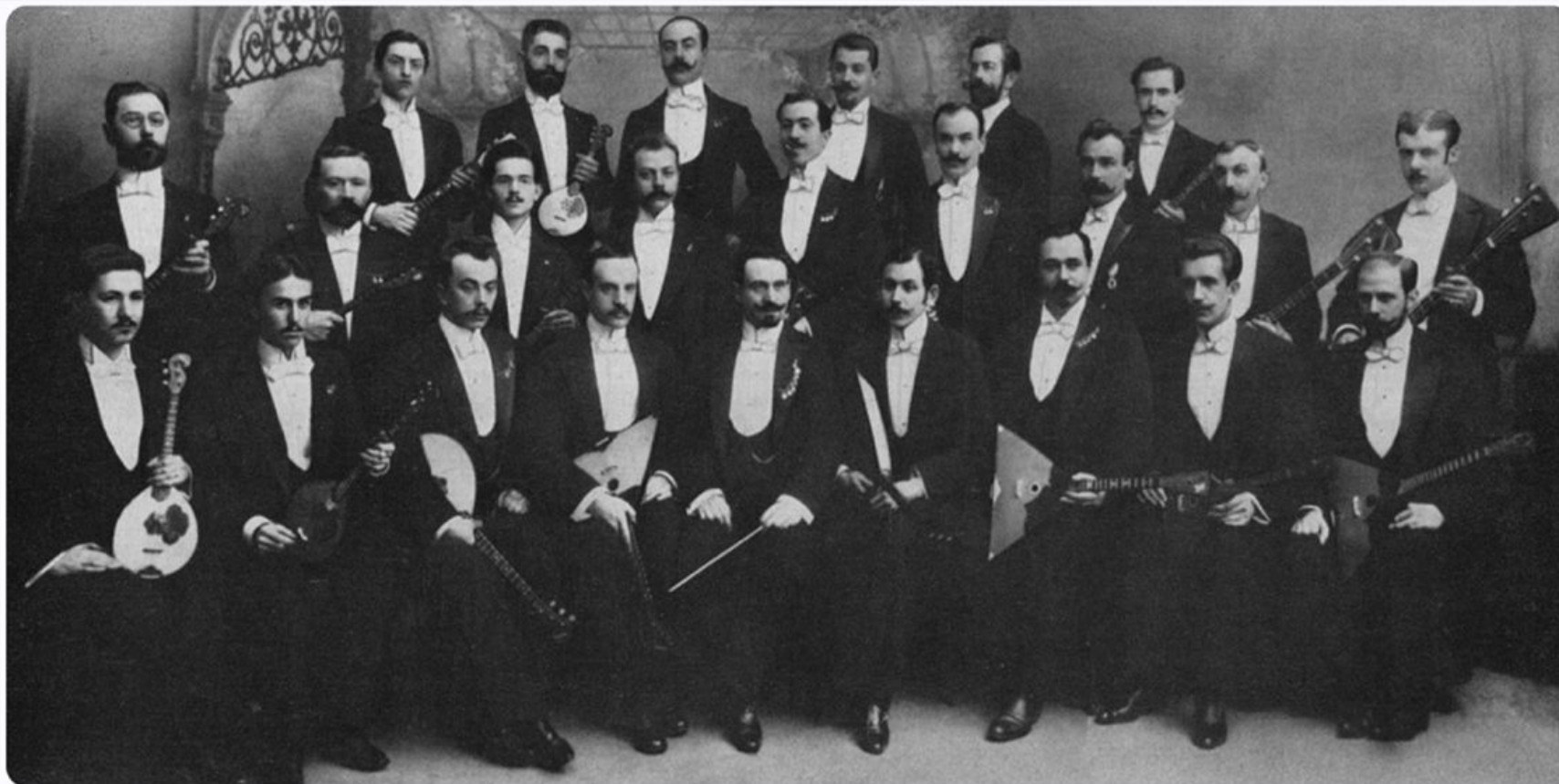
«Великорусский оркестр» под управлением В. В. Андреева