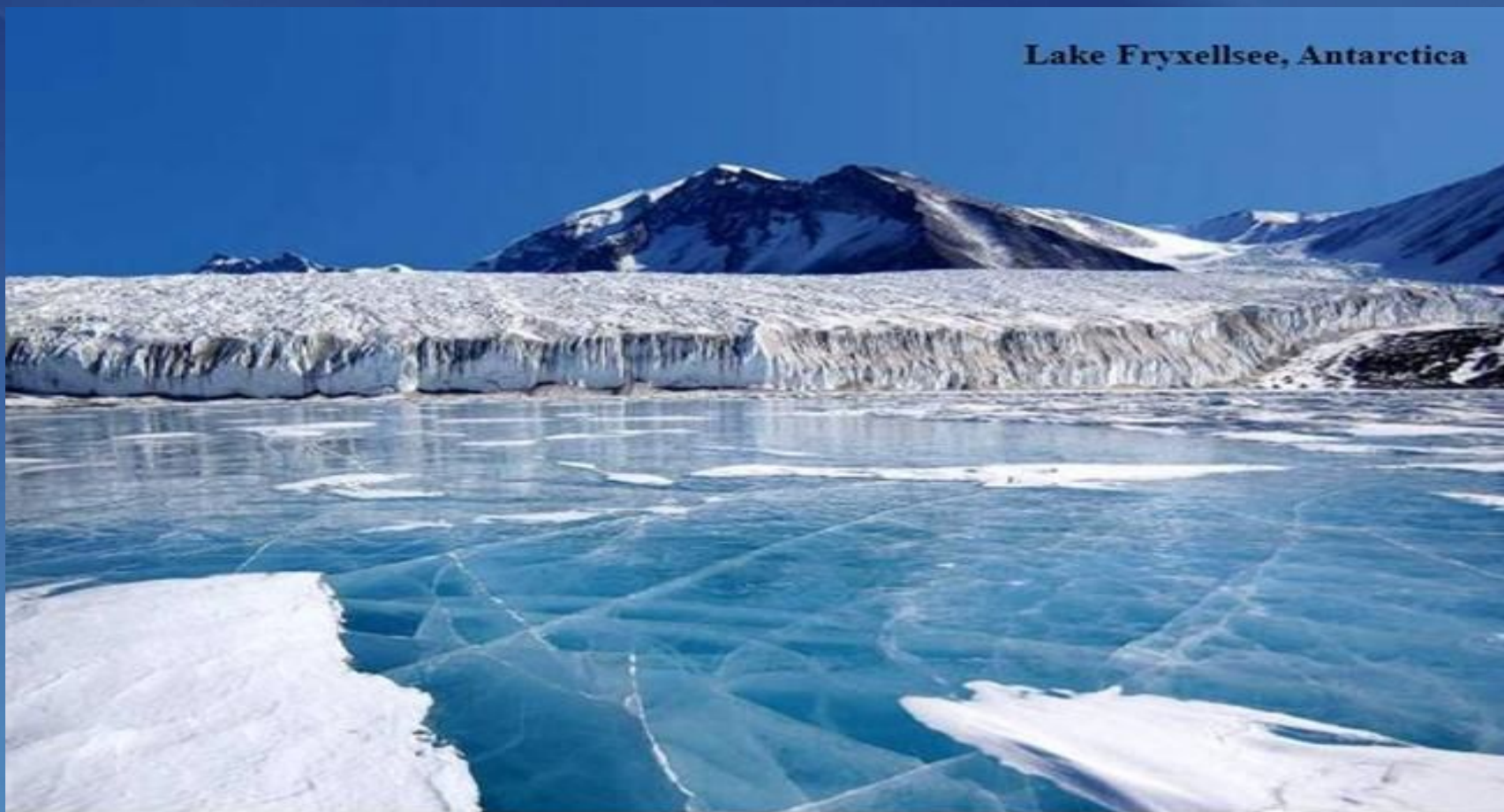
Lake Fryxellsee, Antarctica