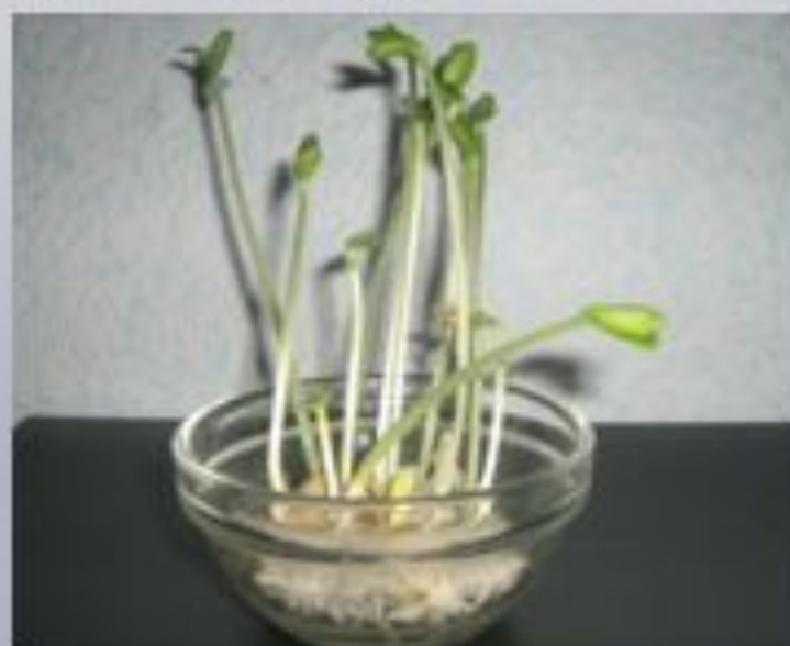
Через 20 дней в воде