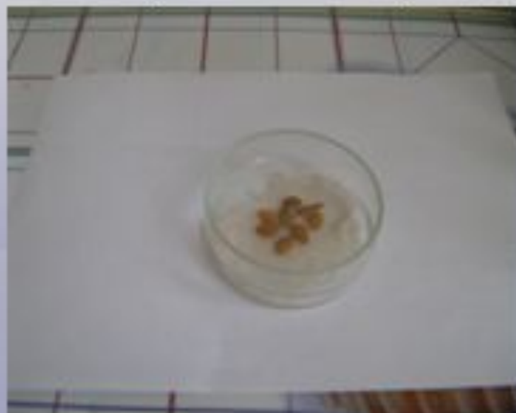
Питательная среда – «алконапиток»