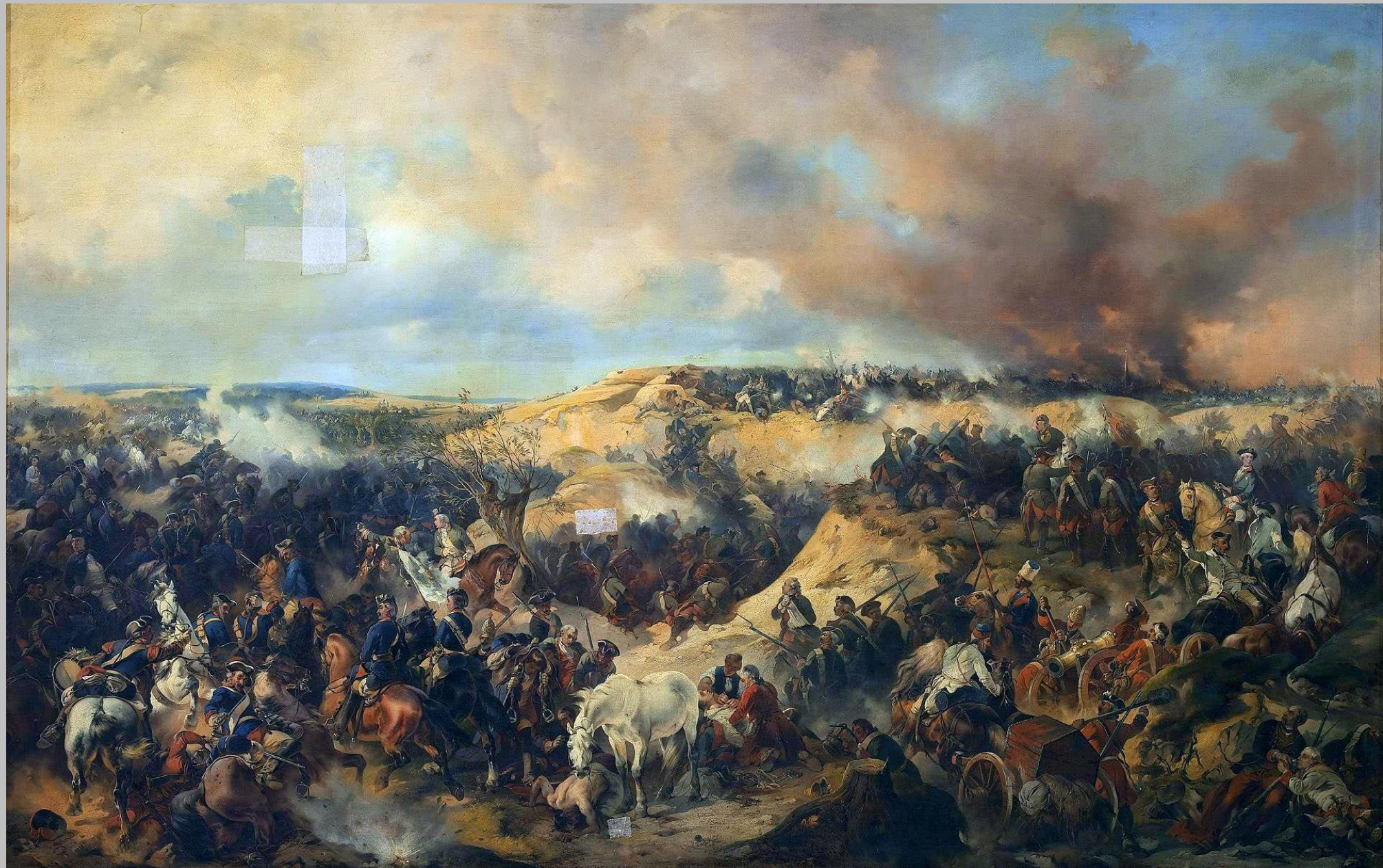
Кунерсдорфское сражение (1759).