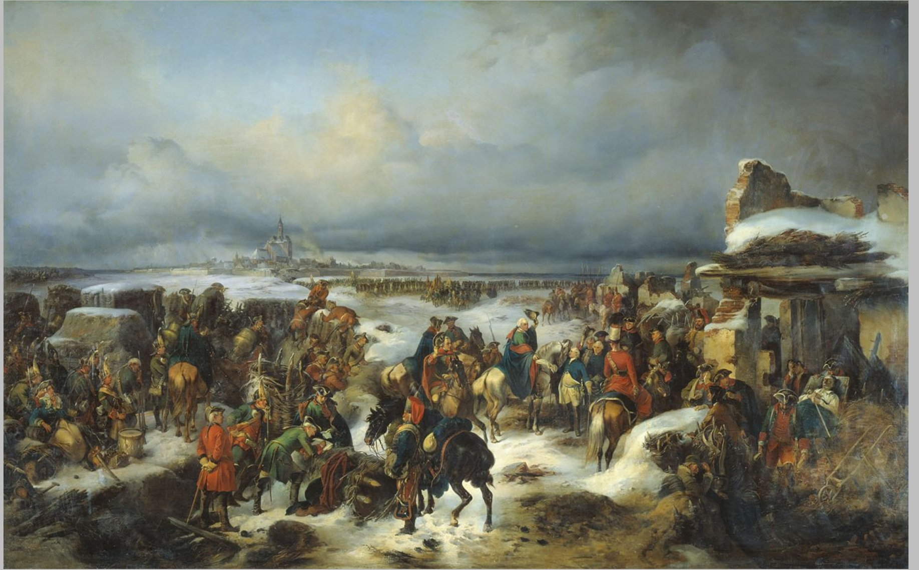
Взятие крепости Кольберг (1761)

В 1761 г., командуя корпусом, он руководил осадой и взятием крепости Кольберг (Колобж ег), в ходе которых впервые в истории русского военного оружия использовал элементы тактической системы «колонна — рассыпной