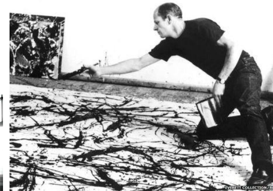
Пол Джексон Поллок