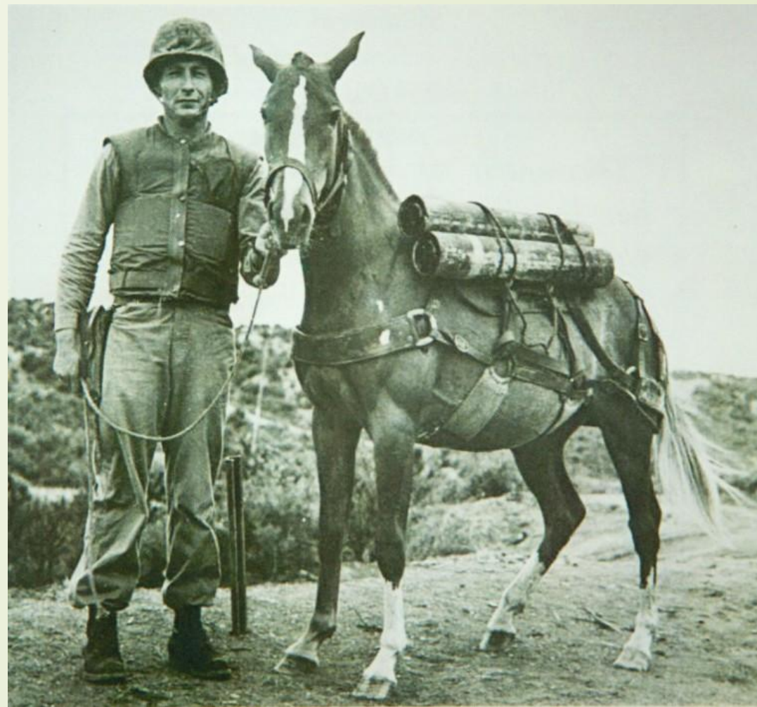
Старший сержант Реклесс

Журнал LIFE включил Реклесс в список ста величайших героев Америки.