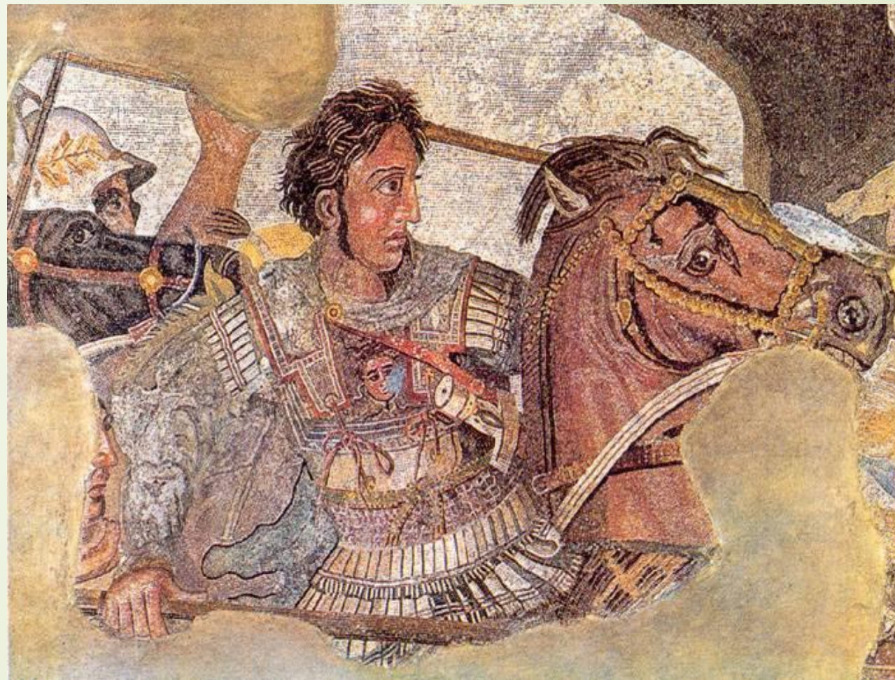
Александр Македонский на своем Буцефале. Фрагмент мозаики из Помпей.

Конь был верным другом великого полководца Александра Македонского в его дальних суровых походах.