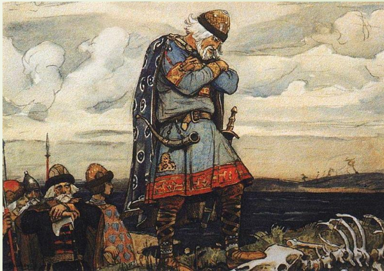
КОНЬ ВЕЩЕГО ОЛЕГА

Олег приказал увести коня, прожил без него много лет и вспомнил о предсказании только через четыре года, после его смерти. Олег посмеялся и захотел посмотреть на кости, встал ногой на череп и сказал: «Его ли мне бояться?» В тот момент из черепа вылезла змея и смертельно ужалила князя.