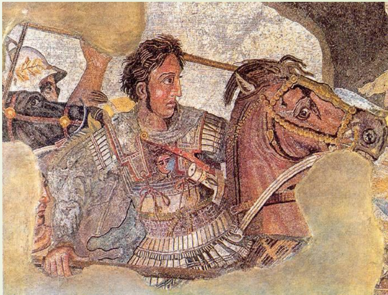
Александр Македонский на своем Буцефале. Фрагмент мозаики из Помпей.

Конь был верным другом великого полководца Александра Македонского в его дальних суровых походах.