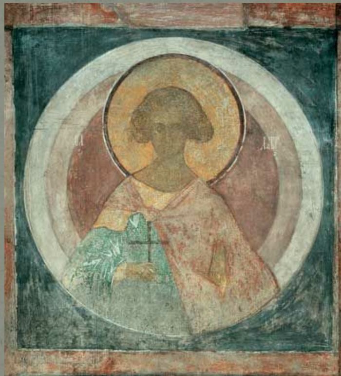
Фреска Святой мученик Лавр