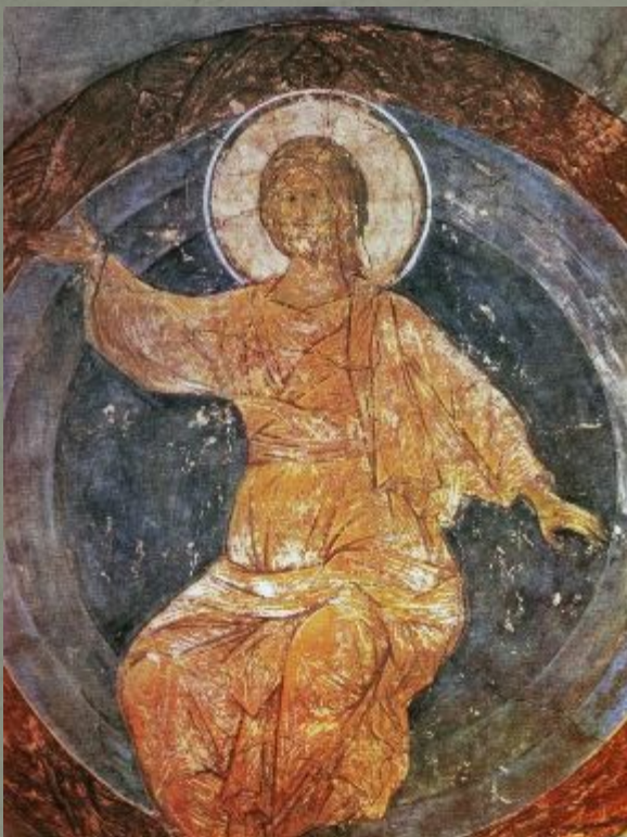
Фреска. Христос во славе. Композиция "Страшный суд".