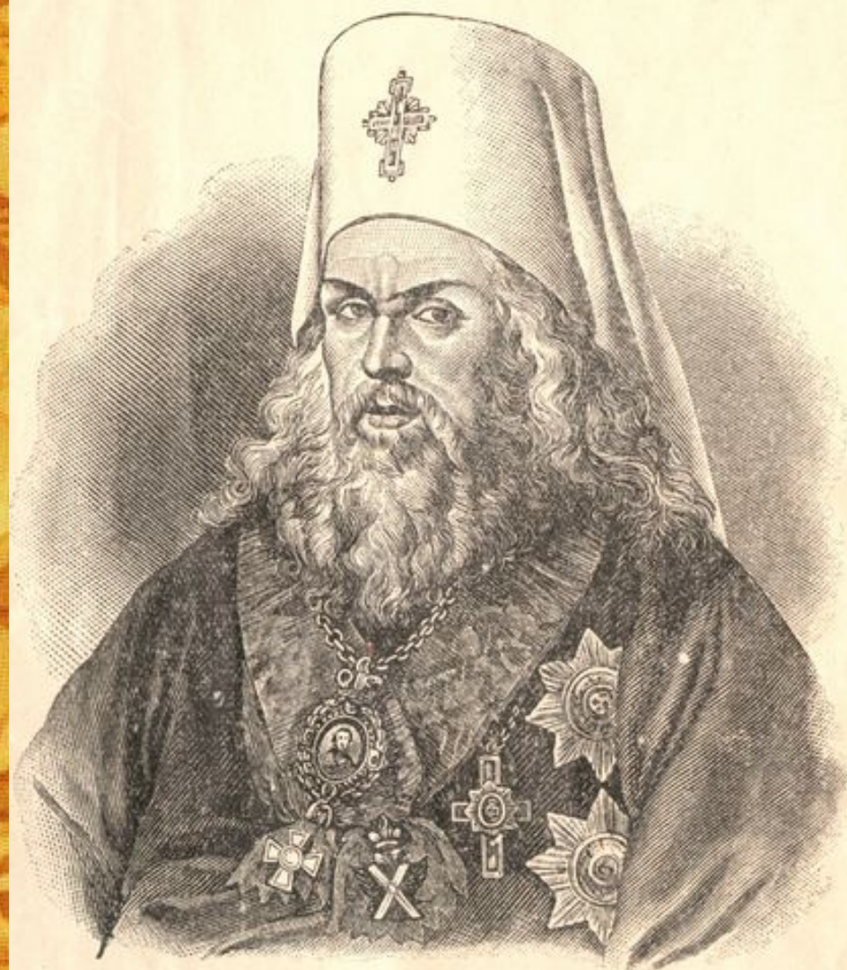
Платонъ II (Левшинъ) Митрополитъ Московскій.