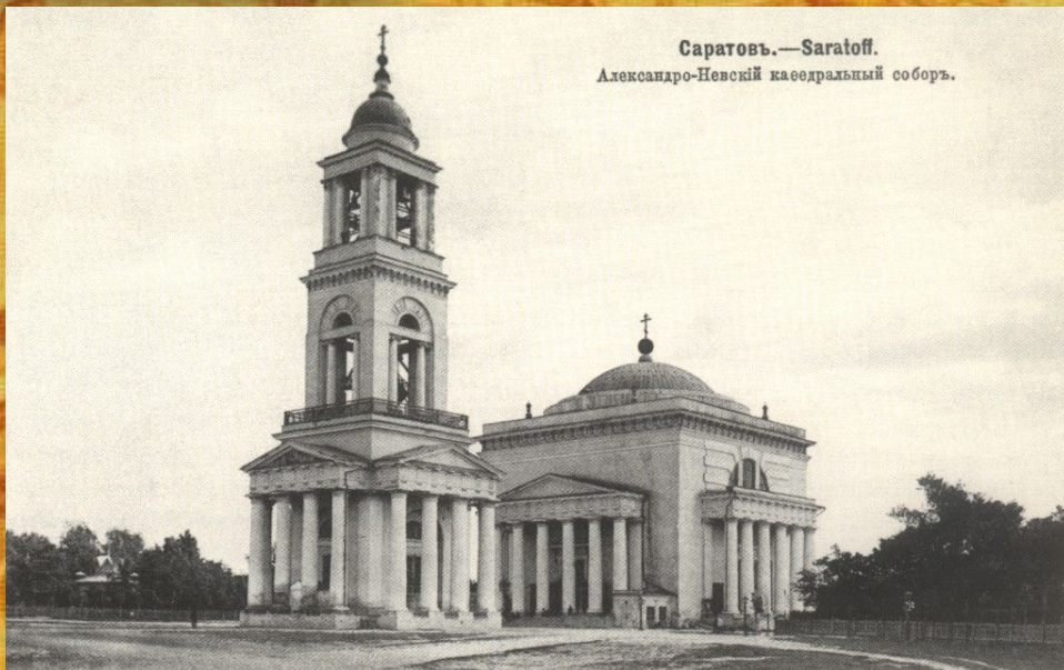
Саратовъ.—Saratoff. Александро-Невскій кафедральный соборъ.