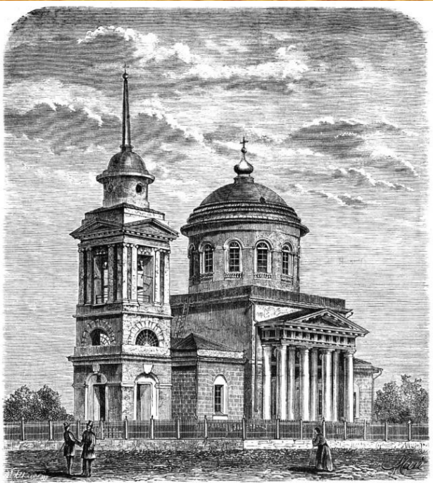
Уфа.—Церковь св. князя Александра Невского. (Рис. Ос. Май, грав. Г. Шлитте).