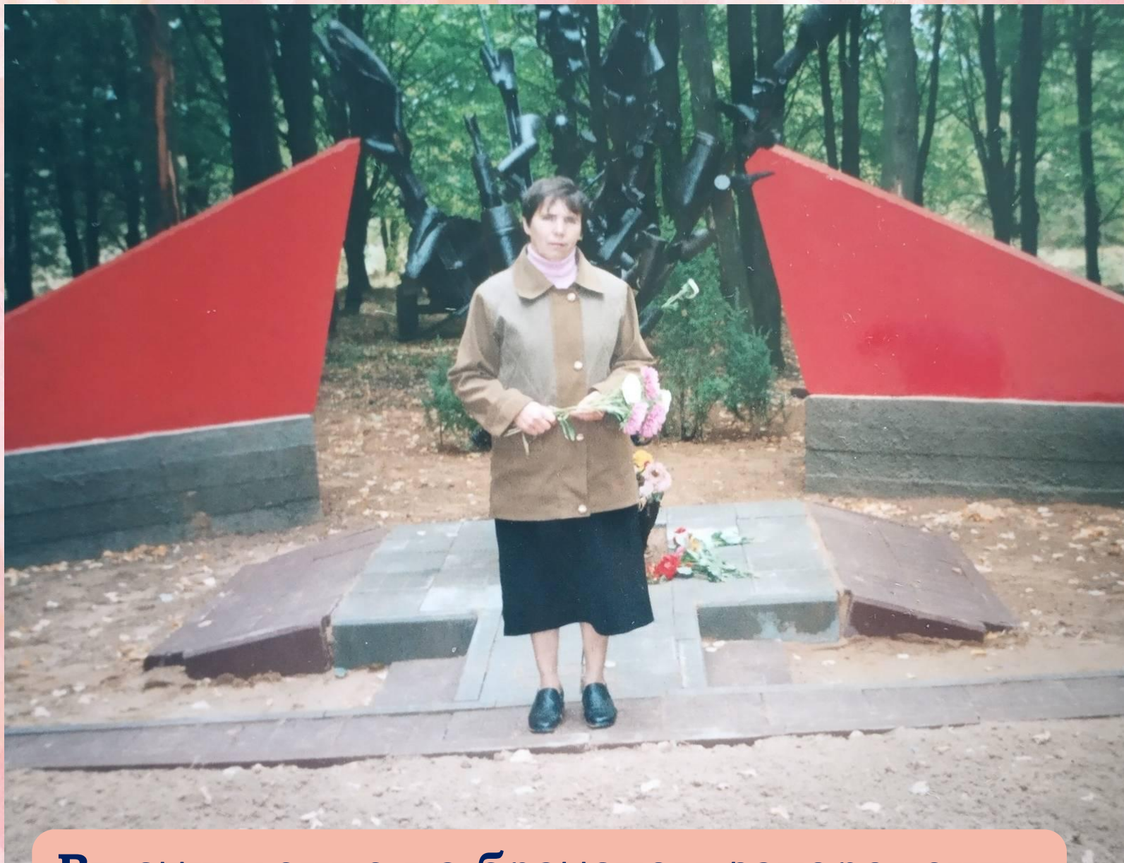
Выступление на братском захоронении в д. Яковлево