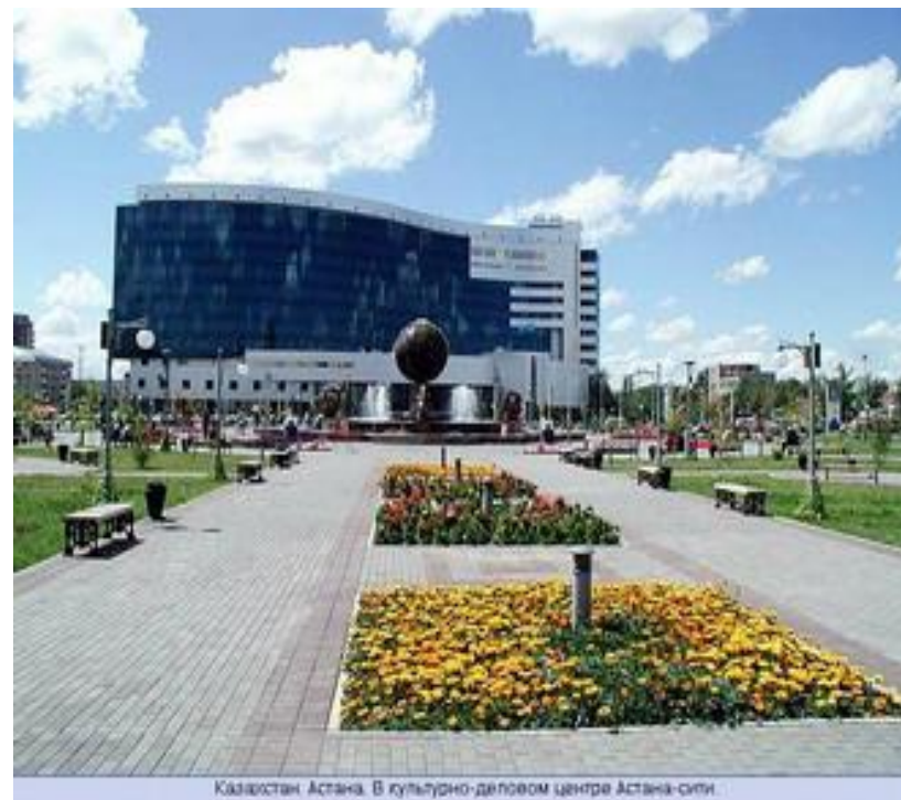
Казахстан. Астана. В культурно-деловом центре Астана-сити.