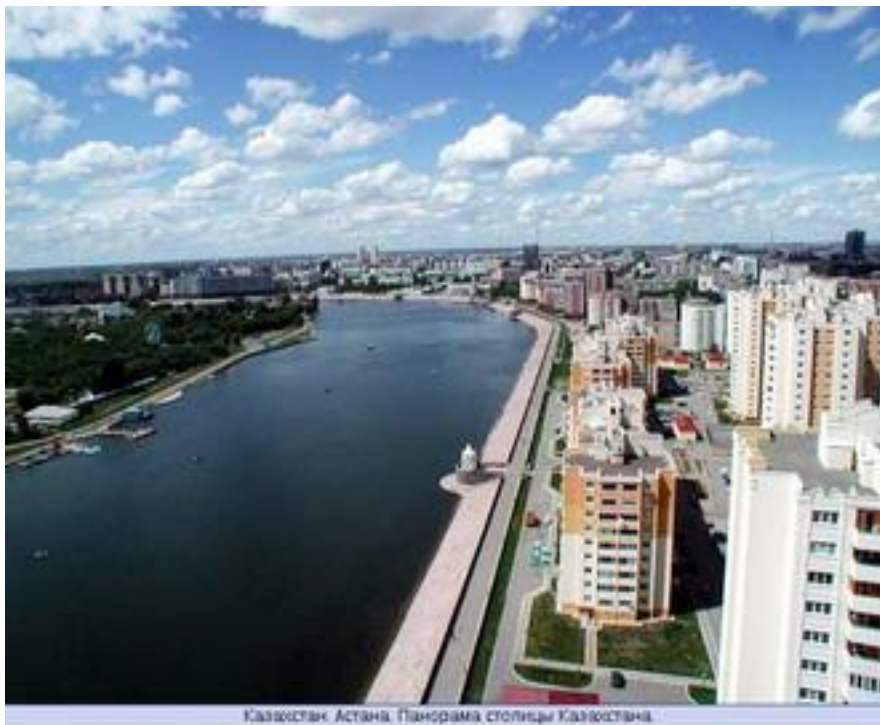
Казахстан. Астана. Панорама столицы Казахстана.

Казахстан имеет большую территорию (2 724 900 кв. км. — 9 место в мире) и сравнительно малое население (15,0 миллионов человек). И в то же время обладает заметными запасами природных ресурсов: нефтью, природным газом, различным минеральным сырьём.