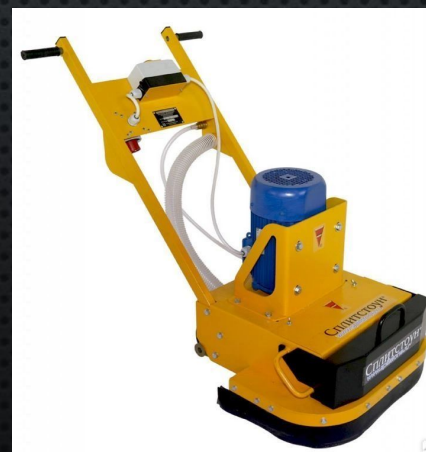
7) Для отделочных работ