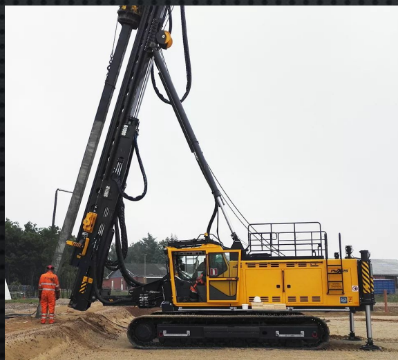
6) Для свайных работ