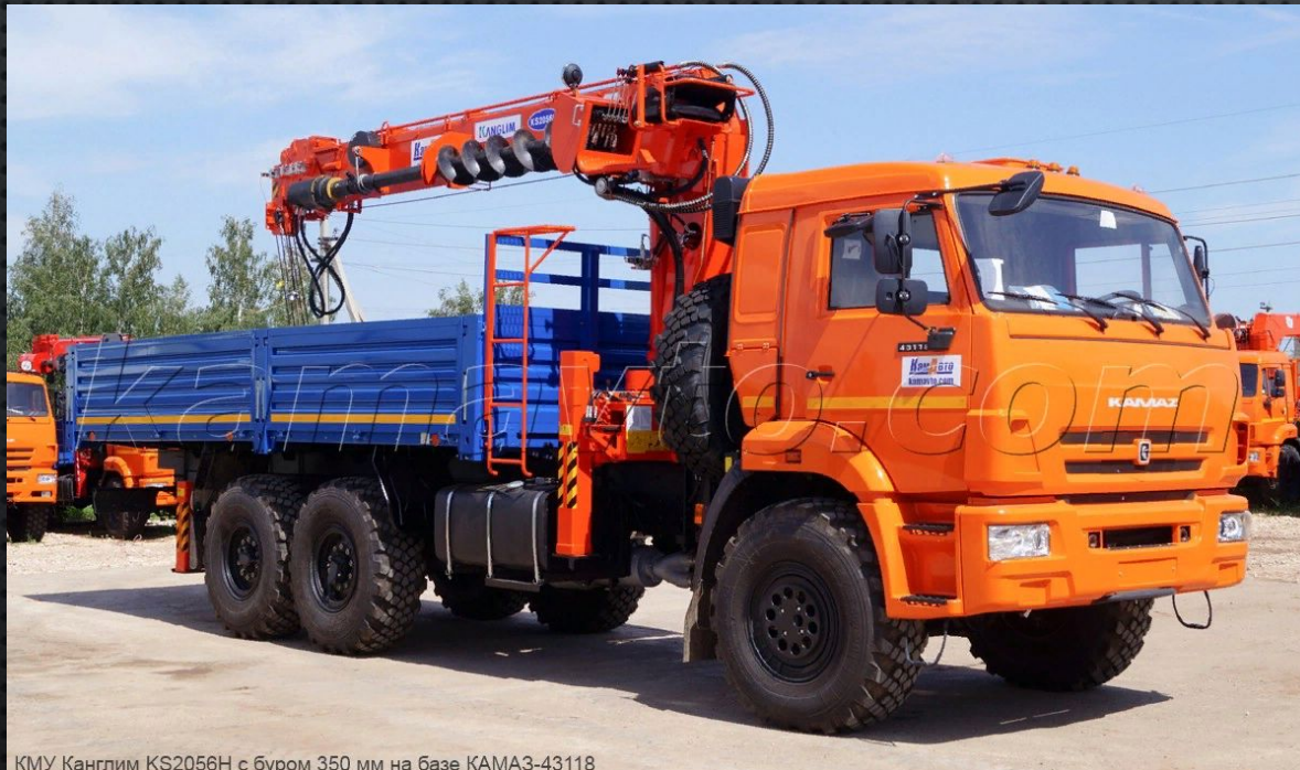
КМУ Канглим KS2056H с буром 350 мм на базе КАМАЗ-43118