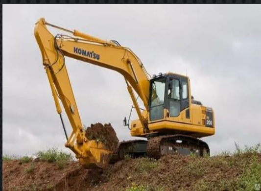
5) Для земляных работ