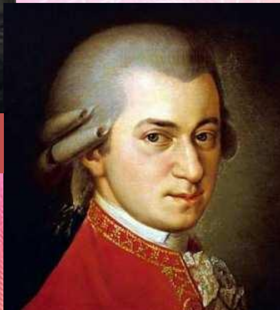
Вольфганг Амадей Моцарт