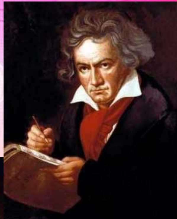
Людвиг ван Бетховен